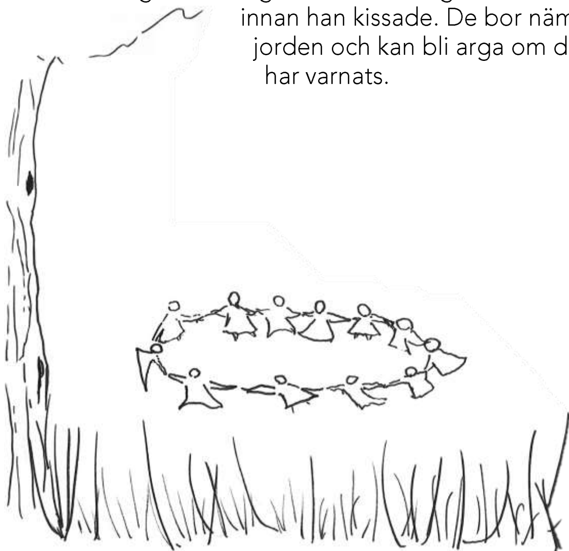
Illustration Sigrid Bakran

innan han kissade. De bor nämligen under jorden och kan bli arga om de först inte har varnats.