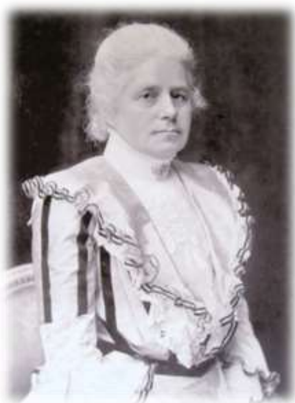
Grevinnan Willhelmina von Hallwyl

Östarps Gästgivargård öppnade 1924, samma år som Kulturens Östarp blev friluftsmuseum. I Stockholm bodde grevinnan Willhelmina von Hallwyl. Hon var rik och ville skänka pengar till Georg Karlin, Kulturens grundare, så att han kunde köpa en stor bit mark här på Östarp. Främst köptes marken för Gamlegårds skull, den vita gården från 1810-talet som du så småningom kommer att gå förbi. Det sägs att grevinnan gärna ville äta gott när hon kom på besök och kanske var det bland annat för hennes skull som gästgivargården byggdes. Förr i tiden var gästgivargårdar viktiga platser där man kunde byta hästar, sova över och givetvis äta mat. På Östarps gästgivargård kan du fortfarande äta god mat.