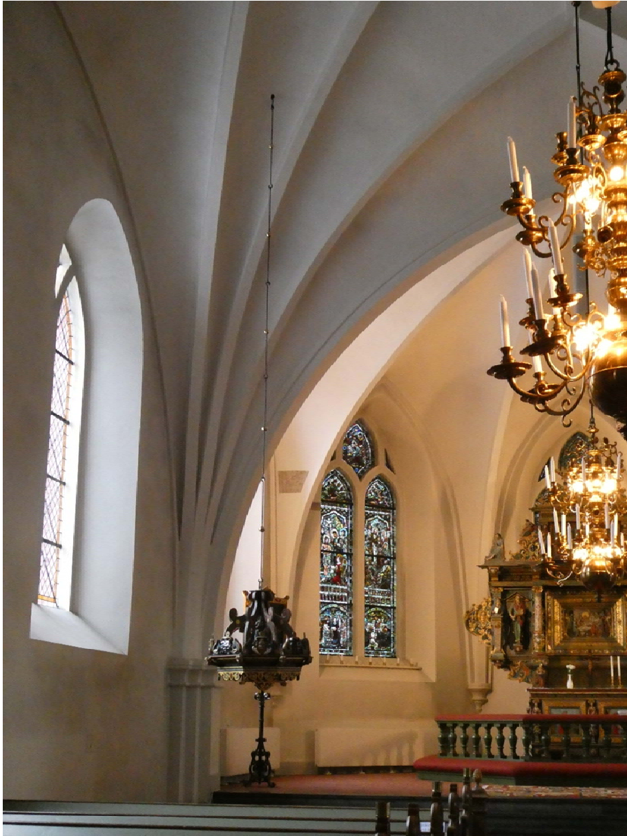
Efter åtgärder med dopfuntsbaldakinen på ny plats i långhuset.