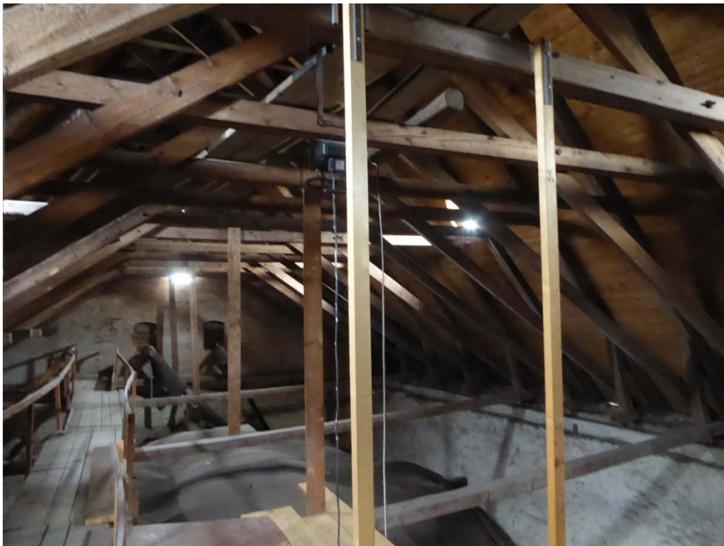
Före åtgärder. Vinden ovan långhuset.