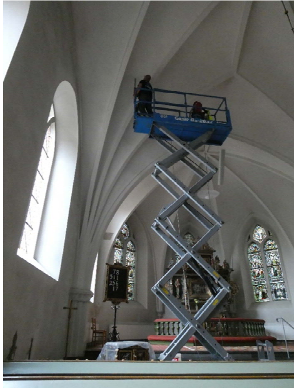
Under arbete med håltagning.