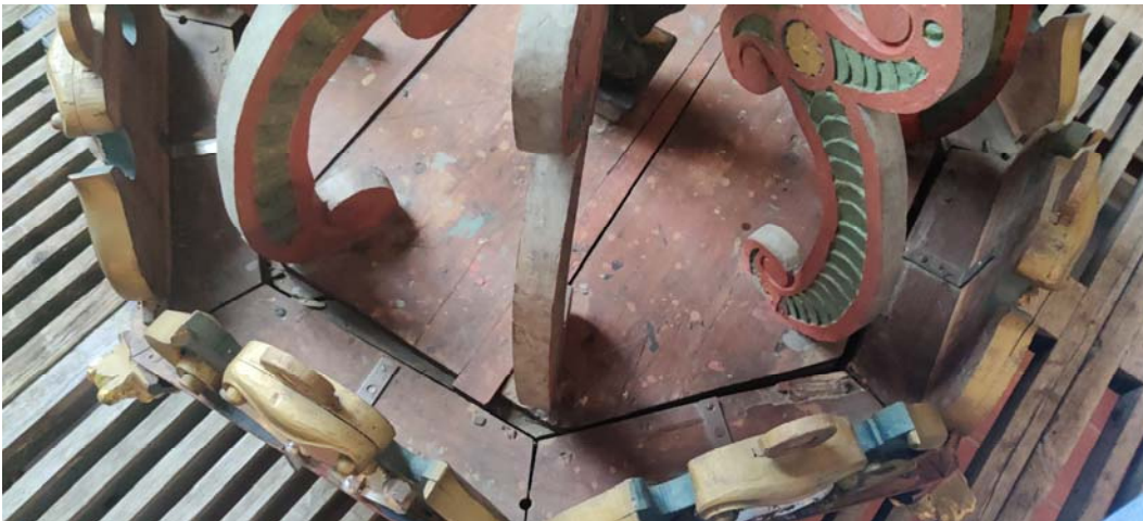
Dopfuntsbaldakinen sett från ovansidan.