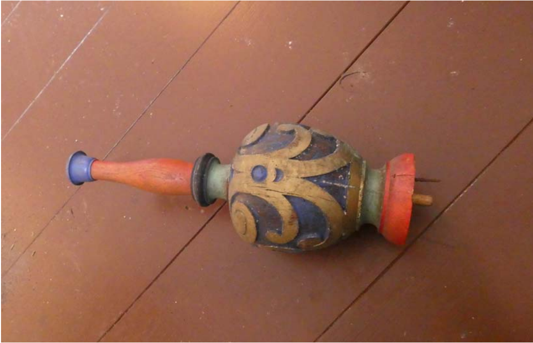
"Spira" i trä som troligen hör till dopfuntsbaldakinen.