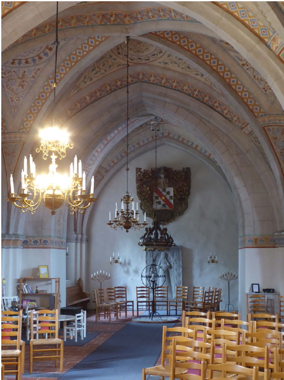
Före åtgärder. Dopfuntsbaldakinen hänger i gamla kyrkans västtorn.