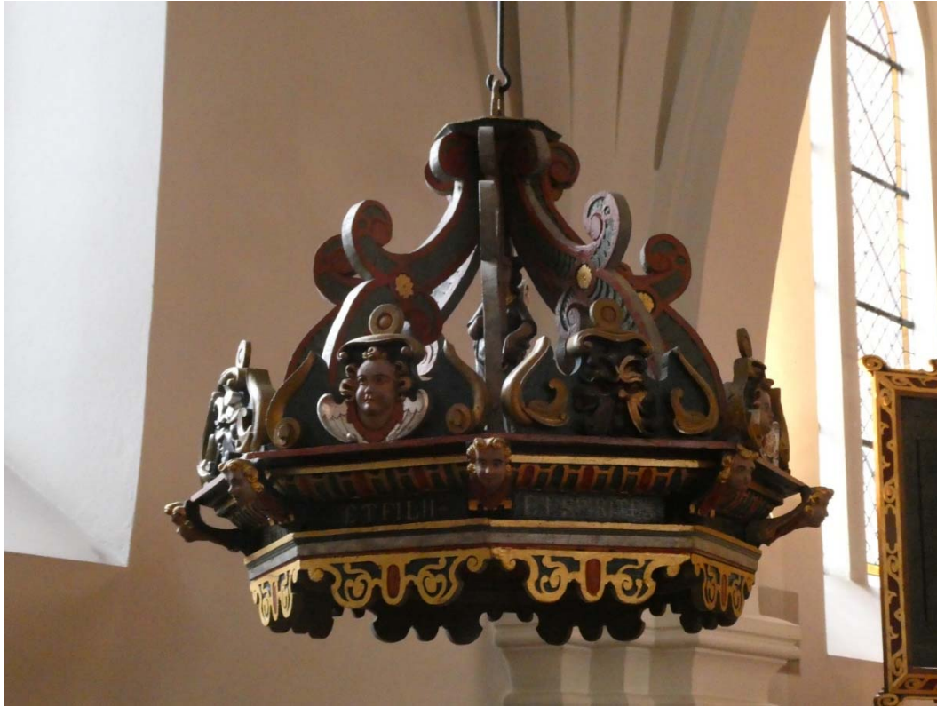
Efter åtgärder, baldakinen är flyttad och upphängd.