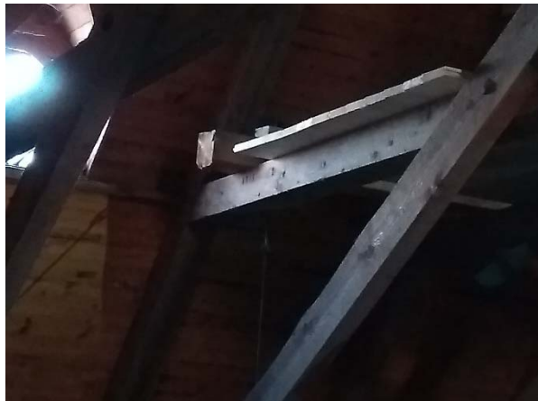
Efter åtgärder. På vinden har tillfogats ny brygga och bjälke över hanbanden för ny upphängning.