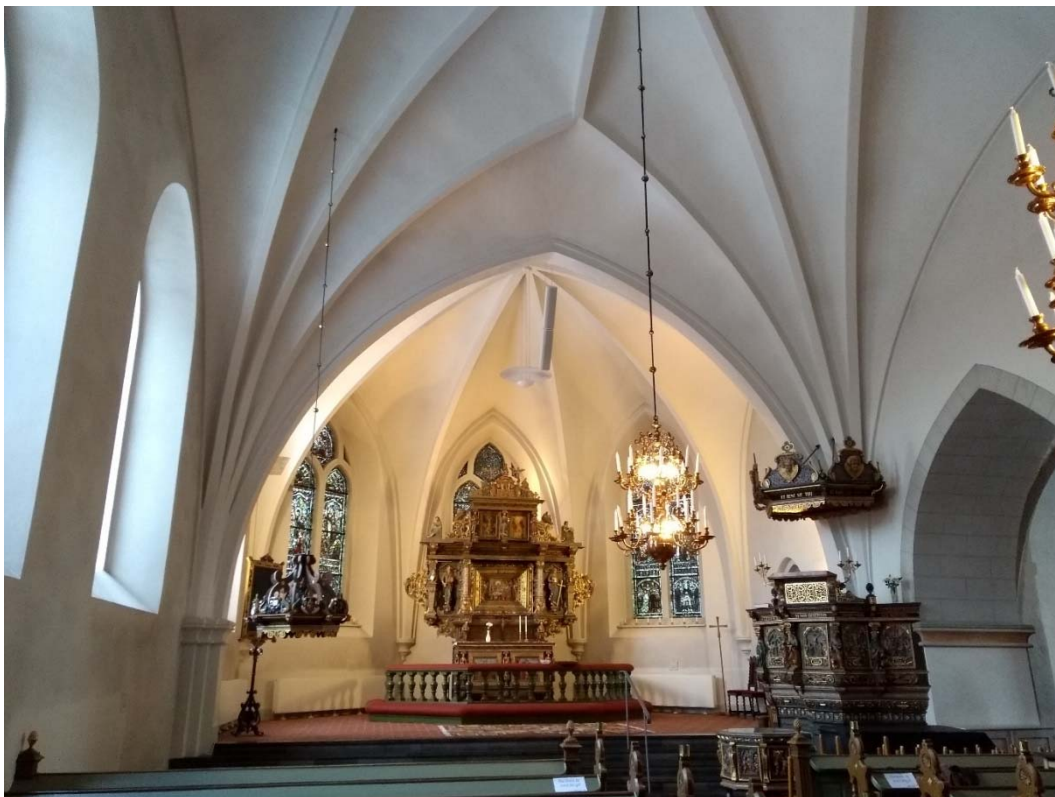
Efter åtgärder med dopfuntsbaldakinen på ny plats i långhuset (på bilden står dopfunten provisoriskt flyttad under byggets tid).