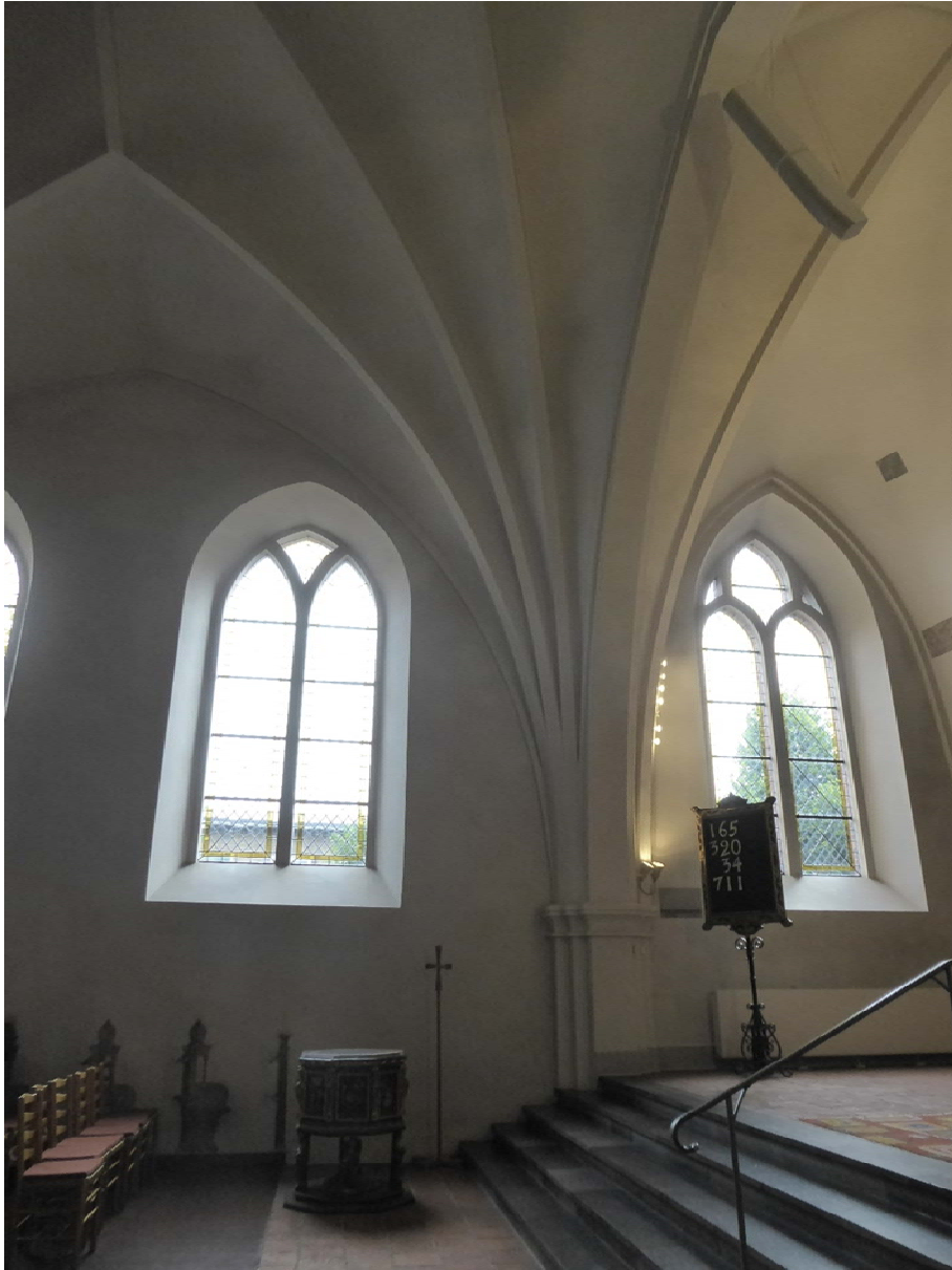
Före åtgärder. Dopfunten står i långhusets nordöstra del framför koret.