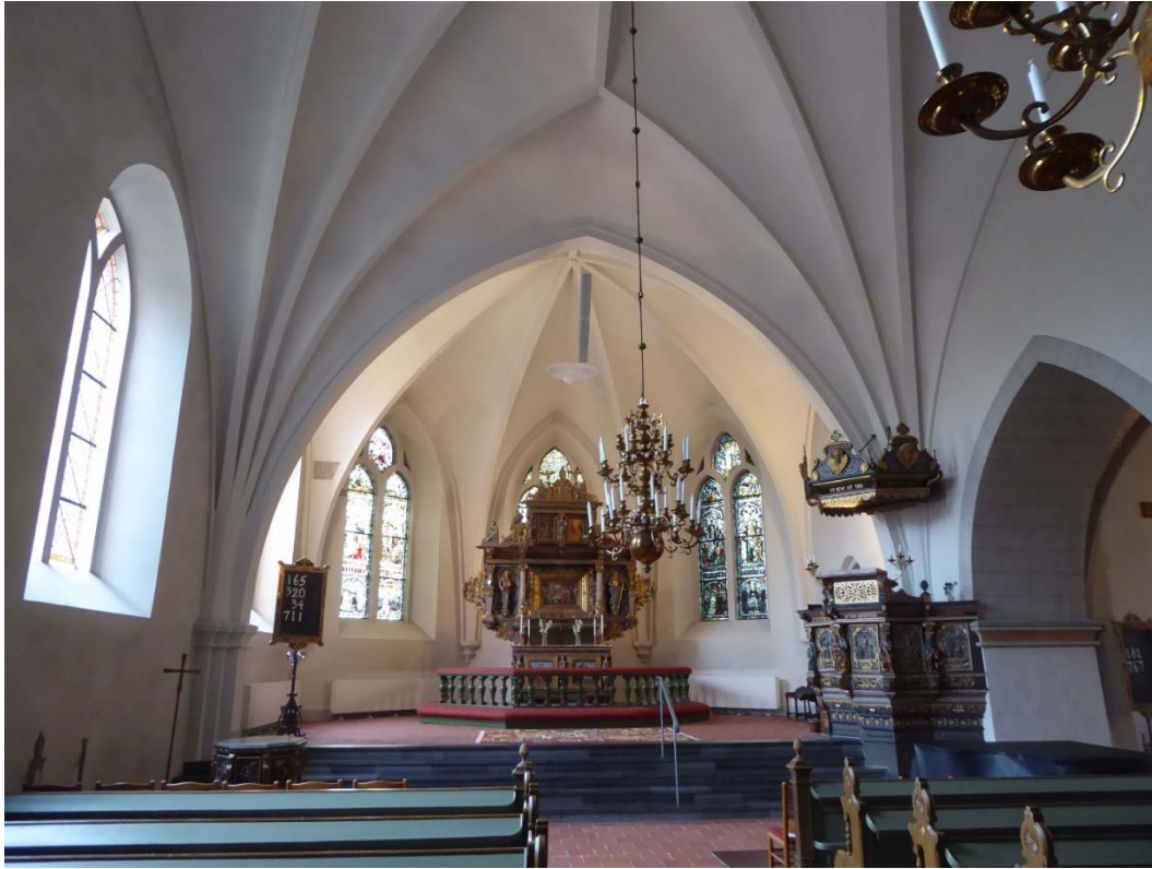
Före åtgärder. Vy mot koret, dopfunten skymtas framför den vänstra bänkraden i bild.