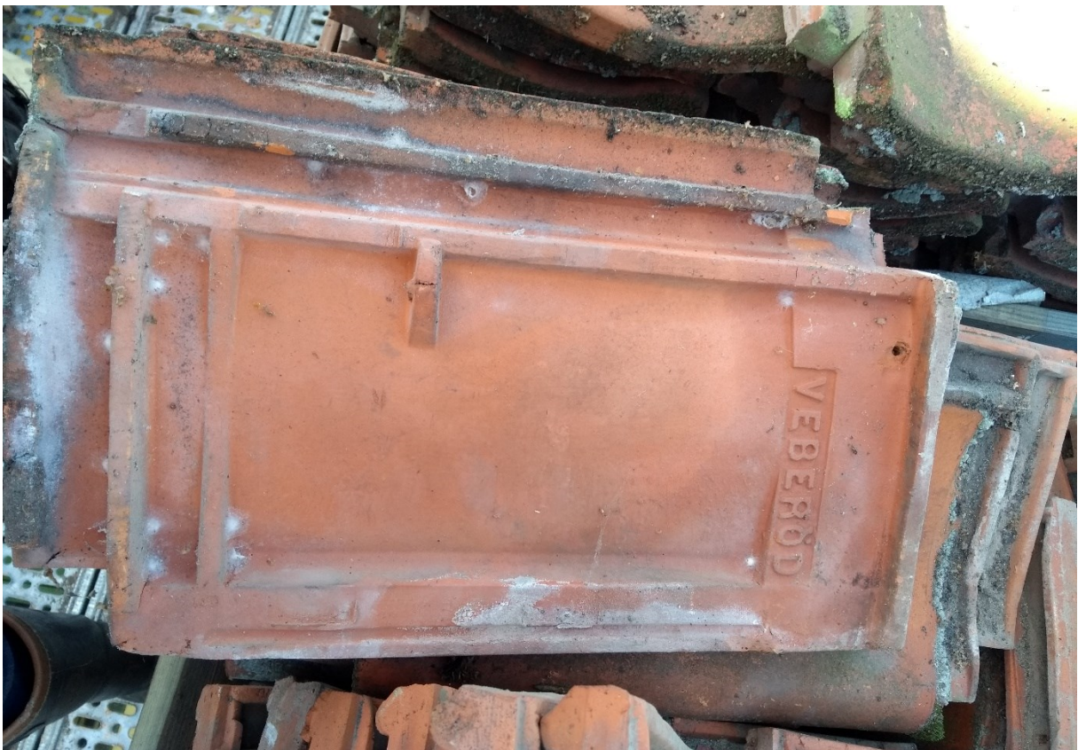
Takpannor tas ner för att tvättas