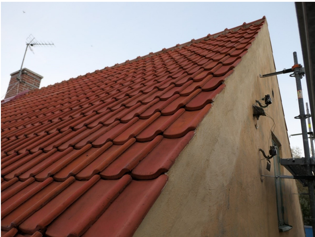
Efter åtgärder. Östra gavelröstet med lagad spricka.