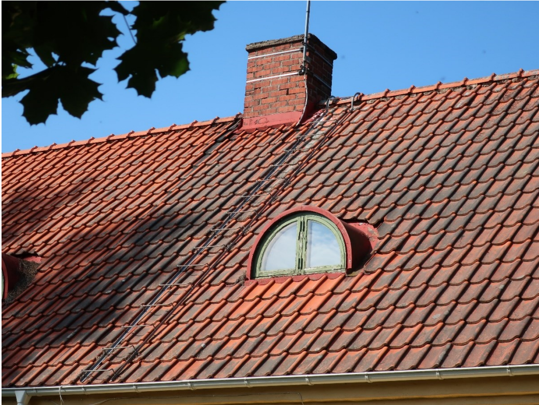
Före åtgärder södra takfallet. Bristfällig fog i skorsten. På bilden syns den gamla takstegen.