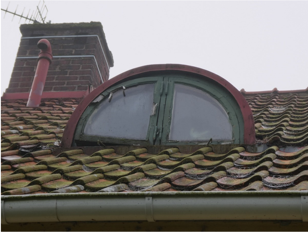
Före åtgärder. Homeja på norra takfallet.