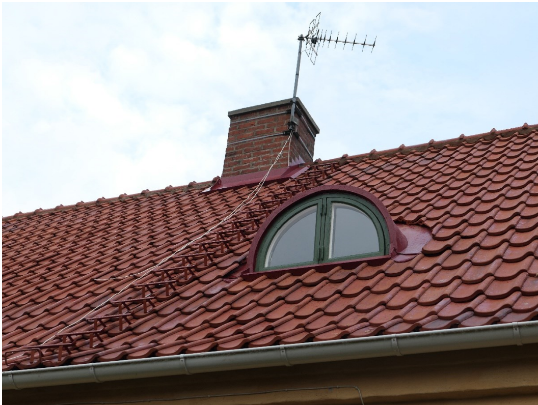
Efter åtgärder. Södra takfallet.