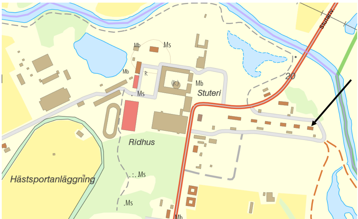
Karta över Flyinge kungsgård. Pilen markerar den aktuella byggnaden.