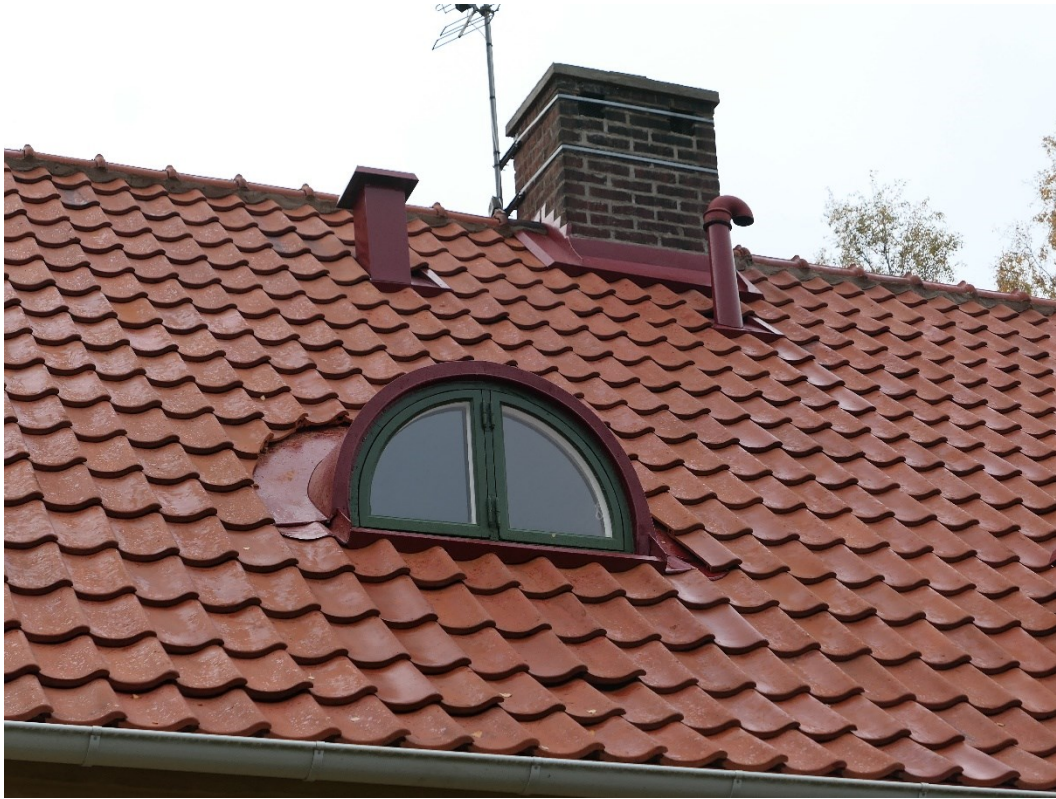
Efter åtgärder. Norra takfallet.