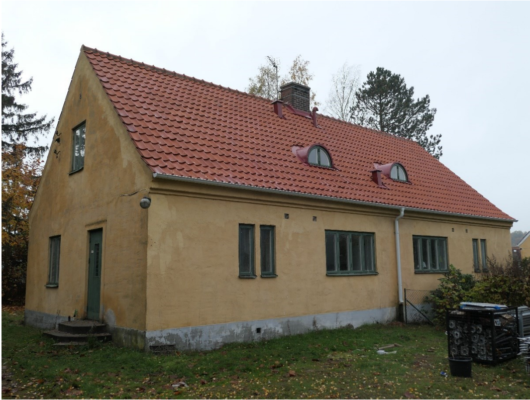
Efter åtgärder norra takfallet.