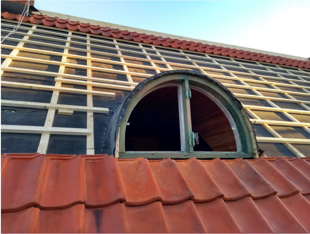
Södra takfallet. Ny papp och läkt, takpannor återmonteras. Fönsterkarm håller på att målas.