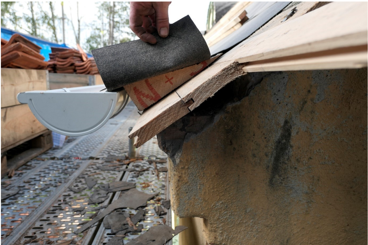
Ny råspont och takfotskil samt avvattning.