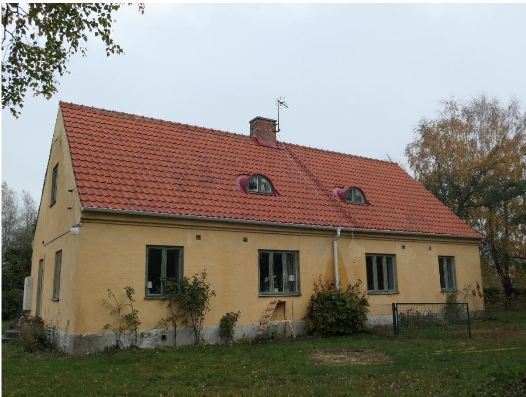
Efter åtgärder södra takfallet.