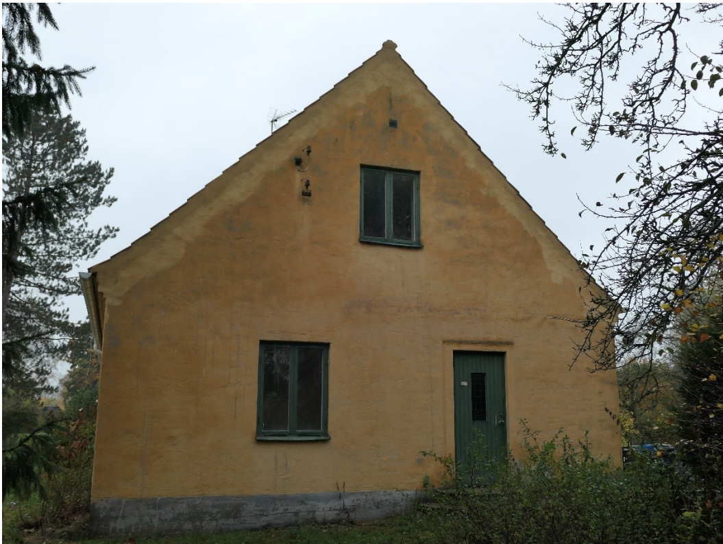
Efter åtgärder östra gaveln.