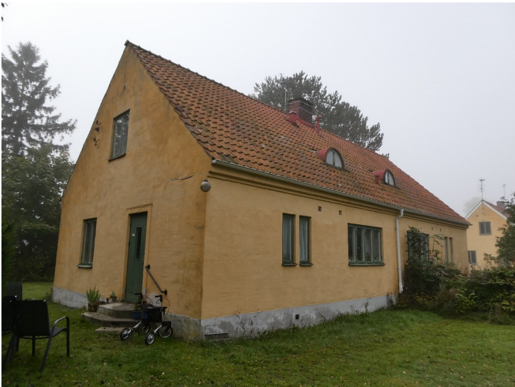
Före åtgärder, norra takfallet och östra gaveln.