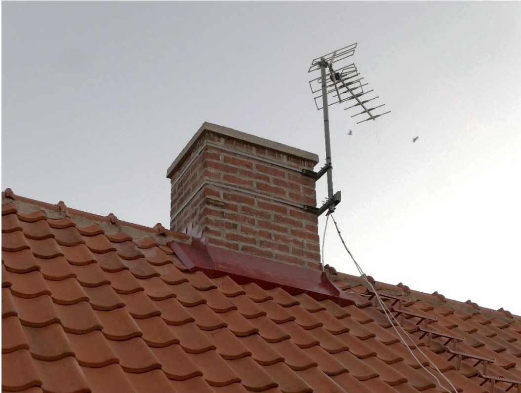
Efter åtgärder skorsten och muradnock.