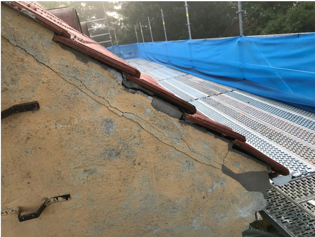
Före åtgärder, sydvästra hörnet.