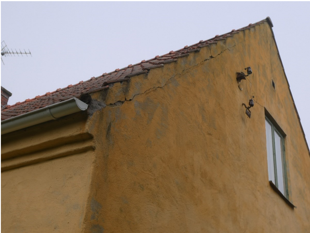
Före åtgärder, spricka i sydöstra hörnet.