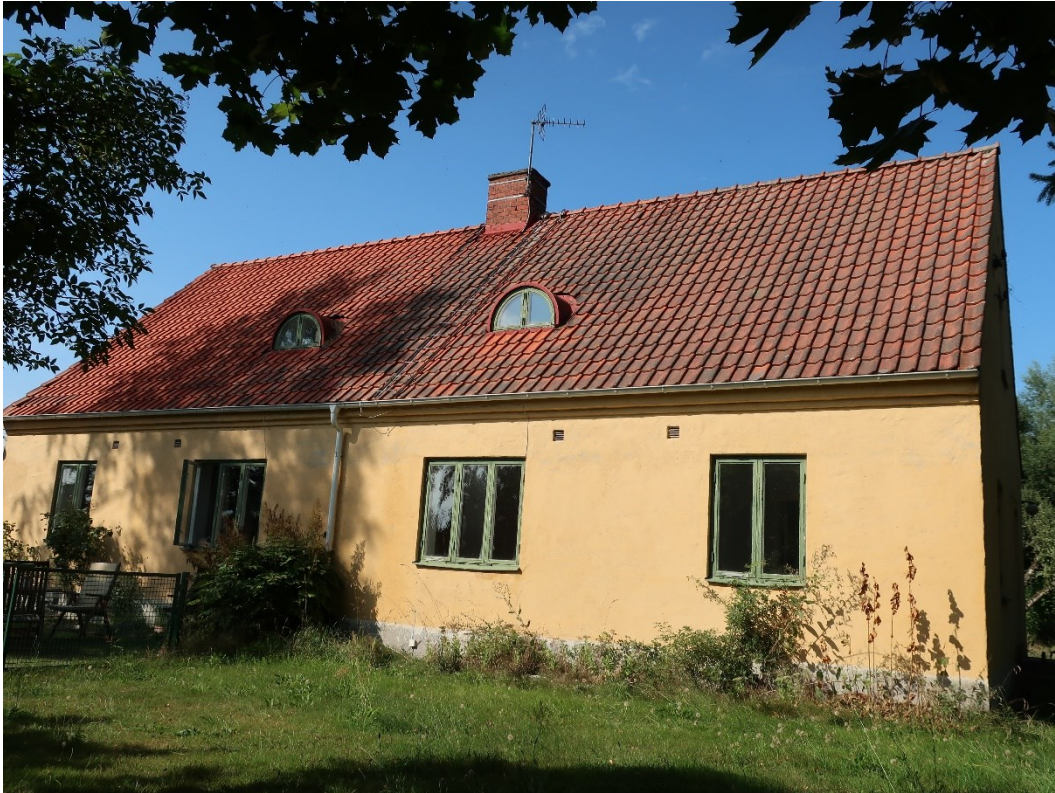
Före åtgärder, södra takfallet.