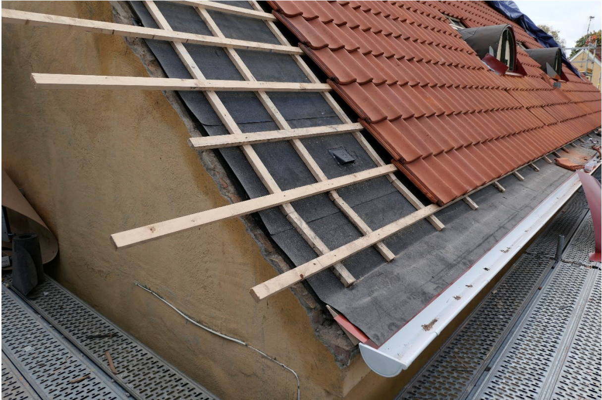
Takpannor håller på att återmonteras.