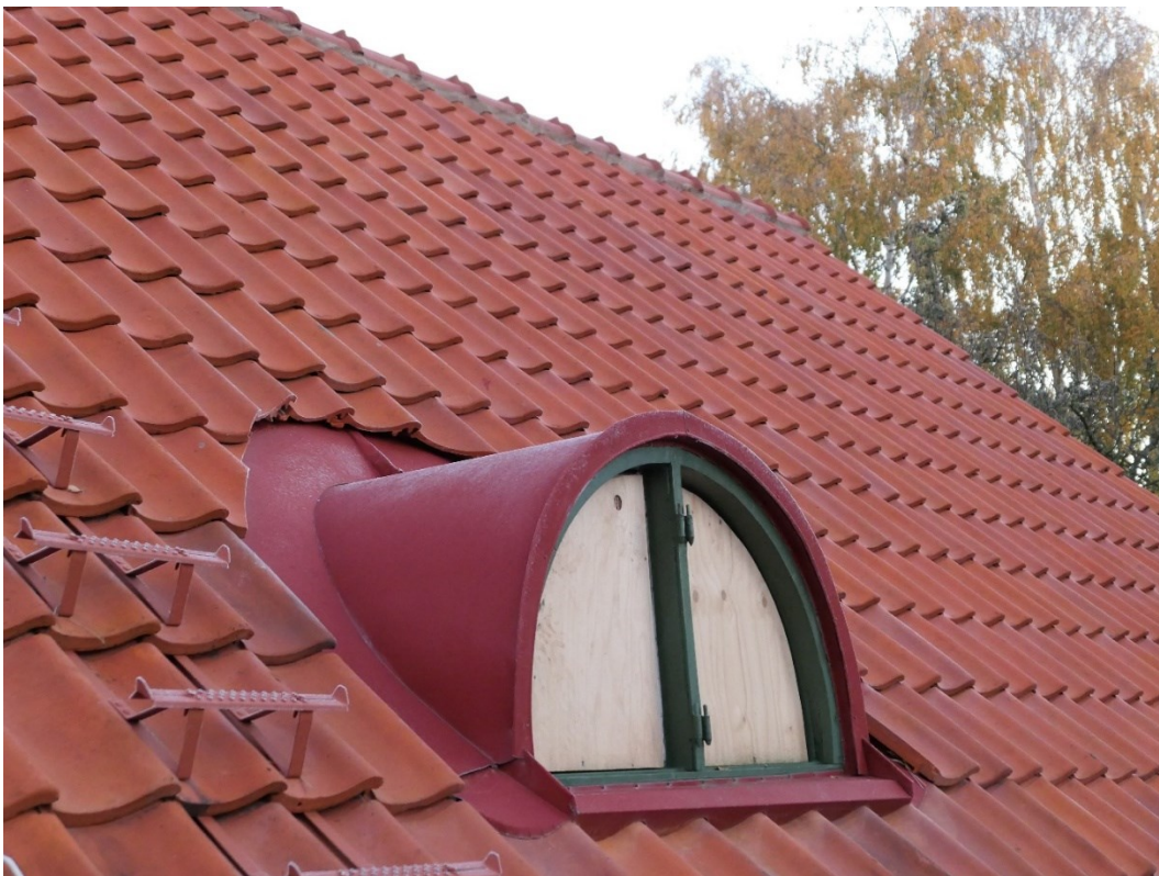
Södra takfallet, återstår endast att återmontera fönsterbågarna. På bilden syns den nya takstegen.