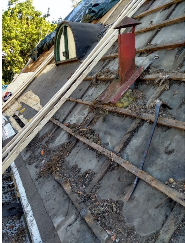
Under arbete. Norra takfallet. Höger: ny råspont läggs, här saknades masonite och isolering. Vänster: takpannorna har demonterats.