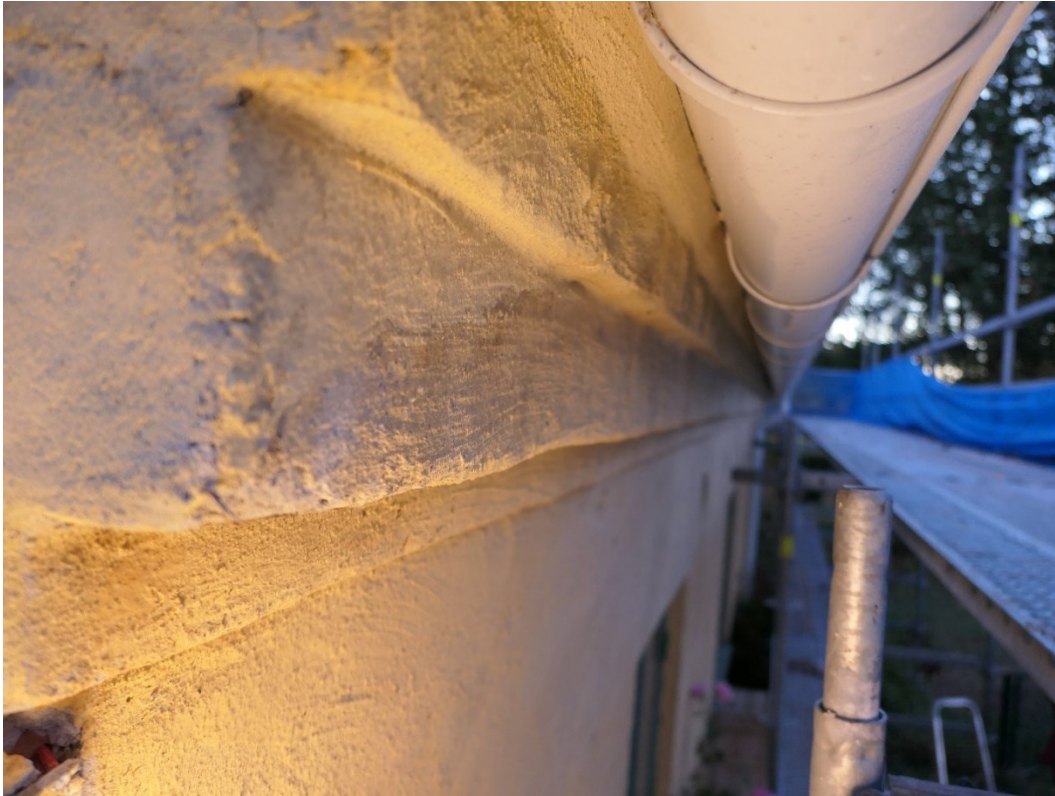
Efter åtgärder. Putslagning i anslutning mot hängränna.