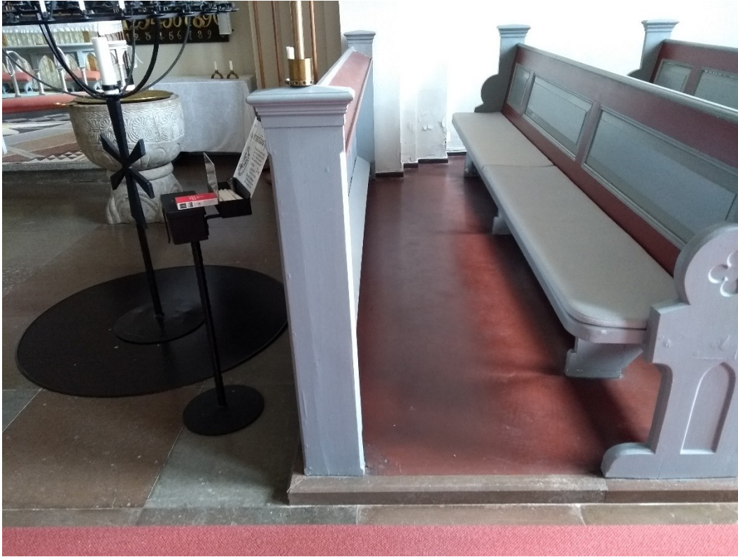
Före åtgärder. Södra korsarmen östra bänkraden och frontpanel.