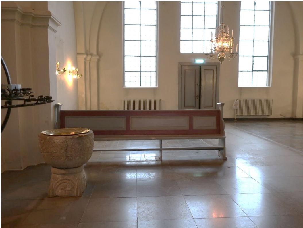
Efter åtgärder. Södra korsarmen med en bänk invid dopfunten.