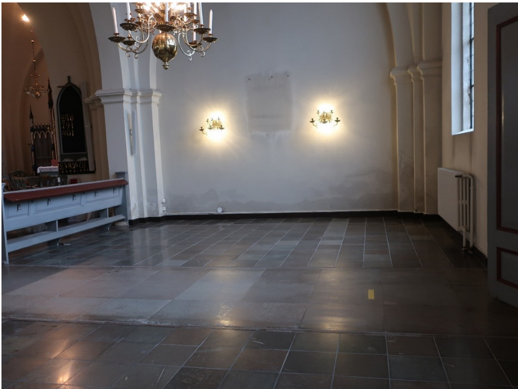
Efter åtgärder. Södra korsarmen.