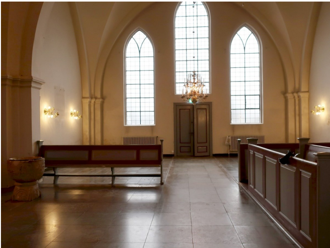
Efter åtgärder. Södra korsarmen. De nya möblerna är ännu inte på plats.