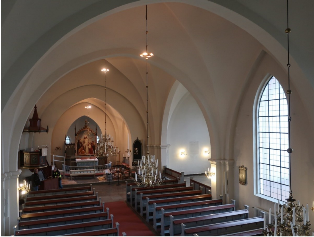
Efter åtgärder. Långhuset med den aktuella södra korsamen till höger i bild.