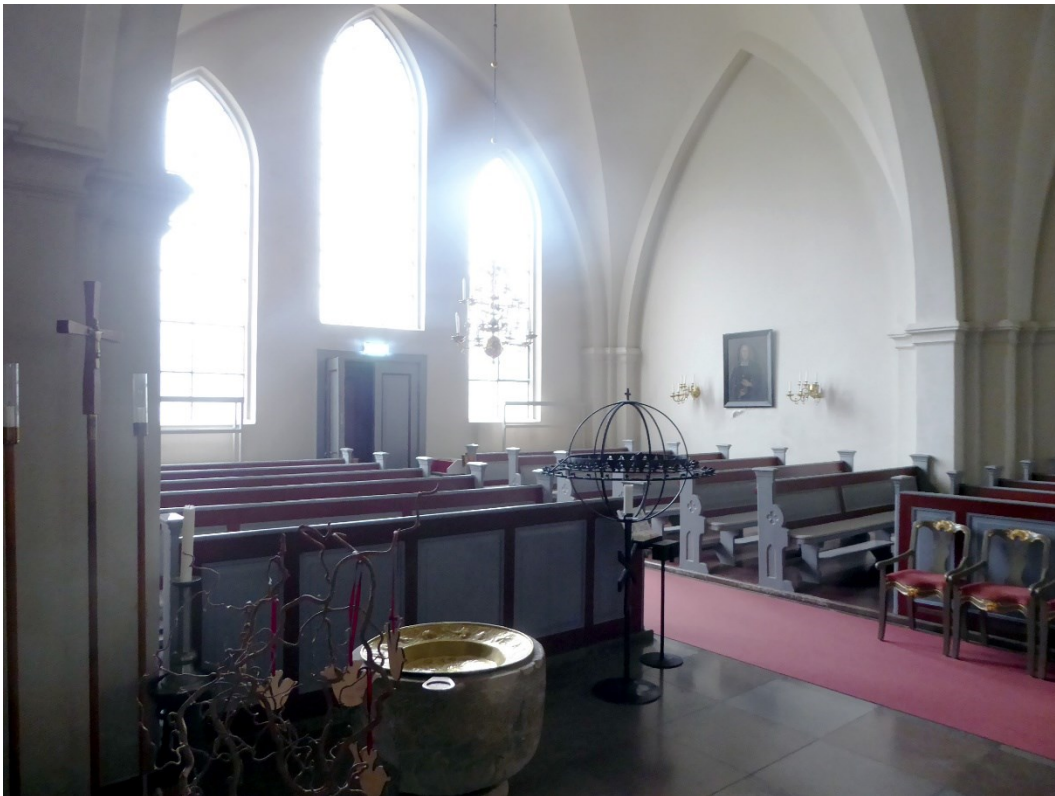
Före åtgärder. Södra korsarmen, vid dopfunten finns frontpanelen som flyttats till motstående sida.