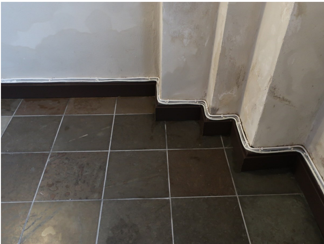
Befintlig kabeldragning och ny sockellist.