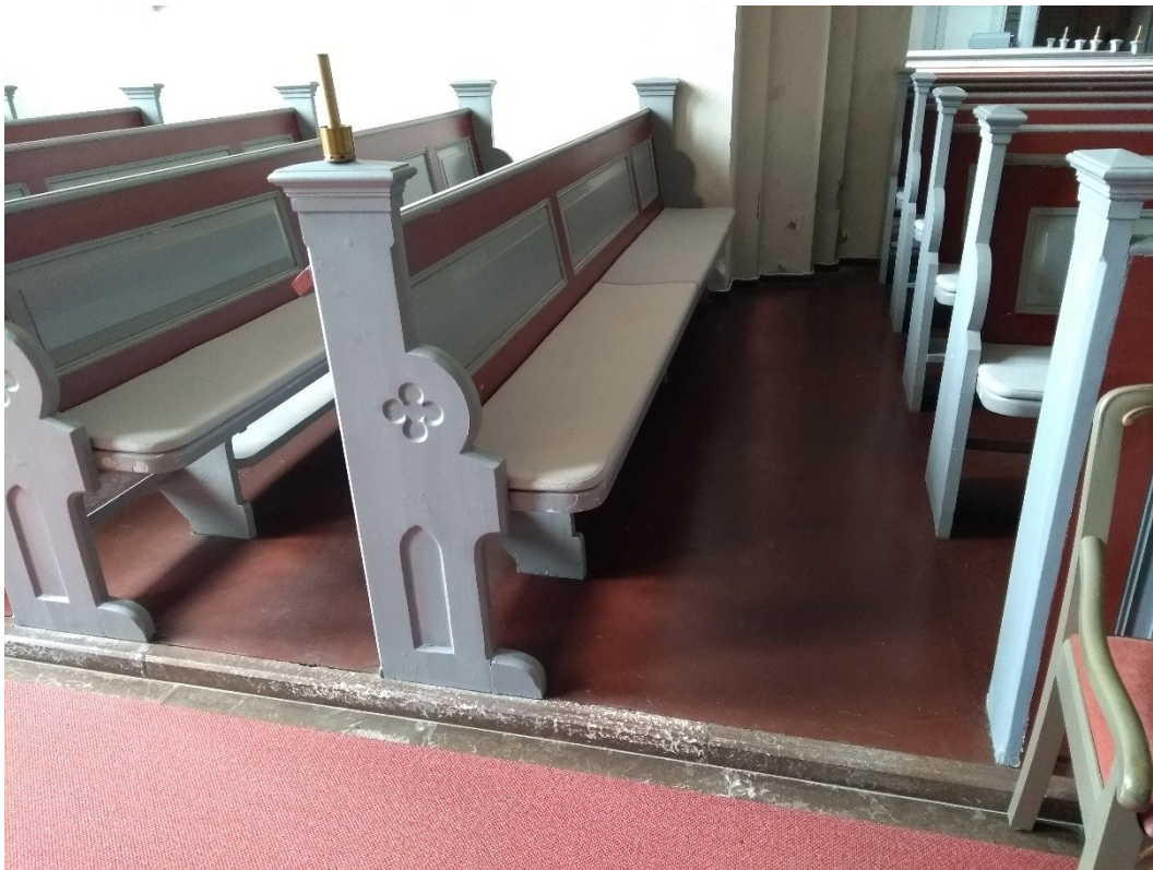
Före åtgärder. Södra korsarmen västra bänkraden. Kantlist av kalksten finns mellan mittgången och det röda dafoleumgolvet.