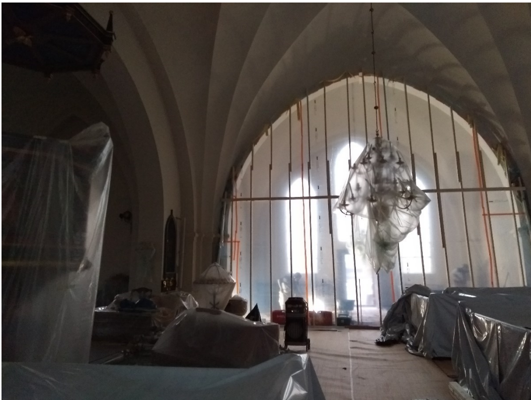
Under arbete. Vy från långhuset mot södra korsarmen. Inredning och inventarier är täckta med plast.