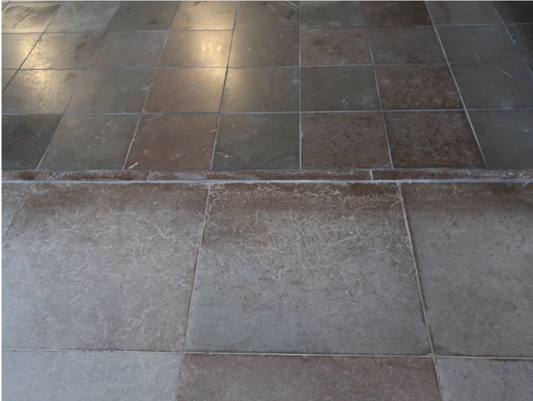
Efter åtgärder. De mindre kalkstensplattorna är nya. Mellan de gamla och nya finns den befintliga kantlisten.