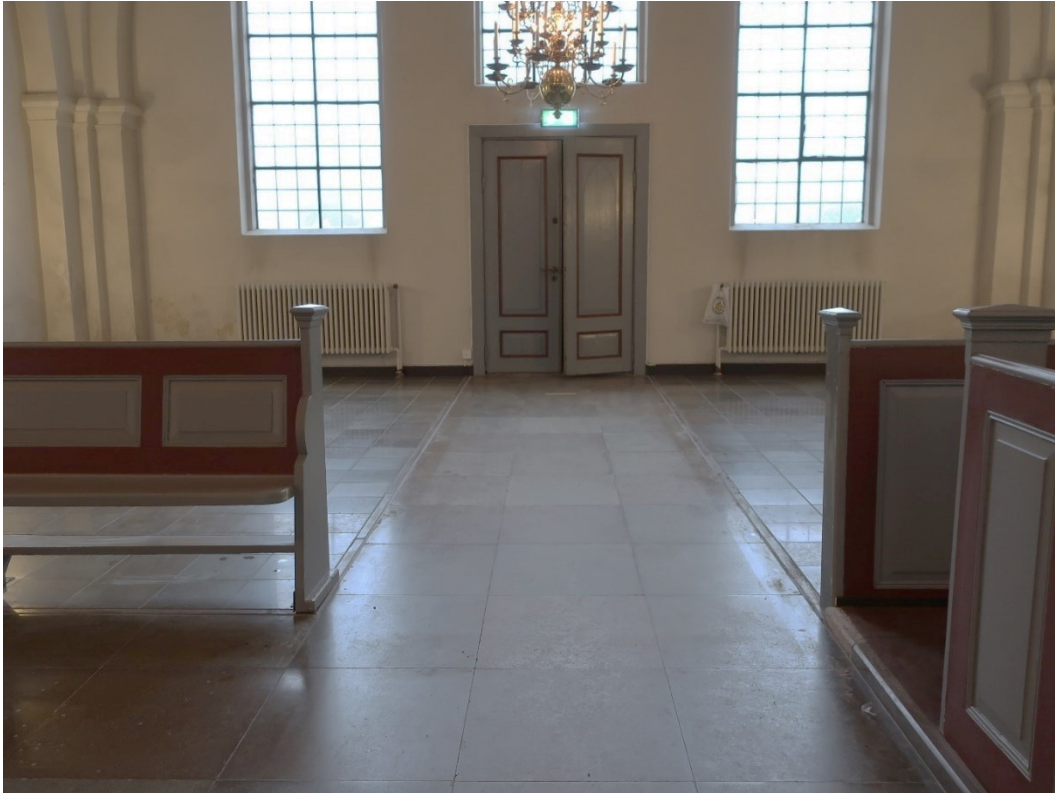
Efter åtgärder. Södra korsarmen.