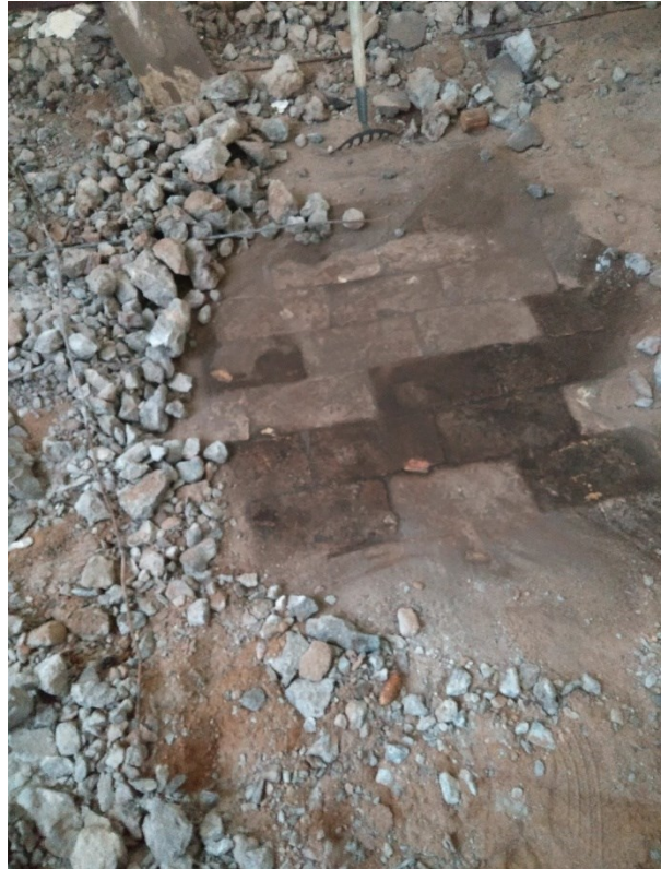
Under arbete. Dافةولمگولف och betongplatta bilas bort. Underliggande tegelgolv behölls.