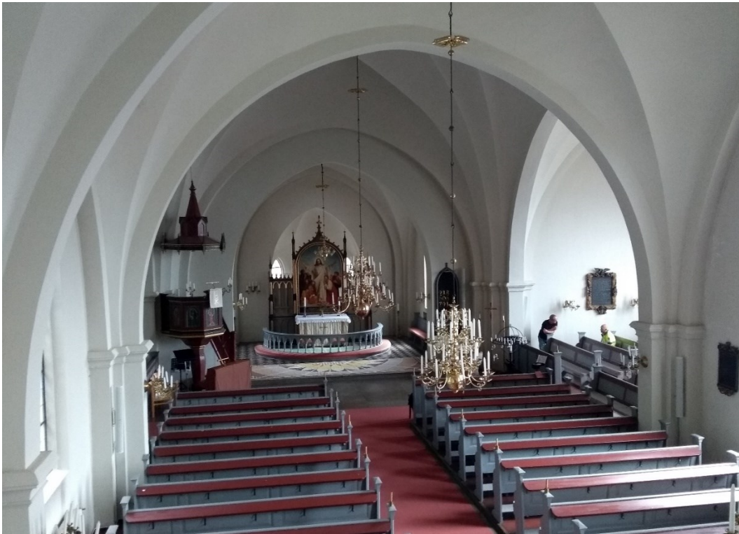
Före åtgärder. Långhuset med den aktuella södra korsamen till höger i bild.