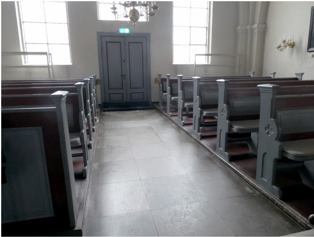
Före åtgärder. Södra korsarmen. Golvet under bänkarna är högre än mittgången.