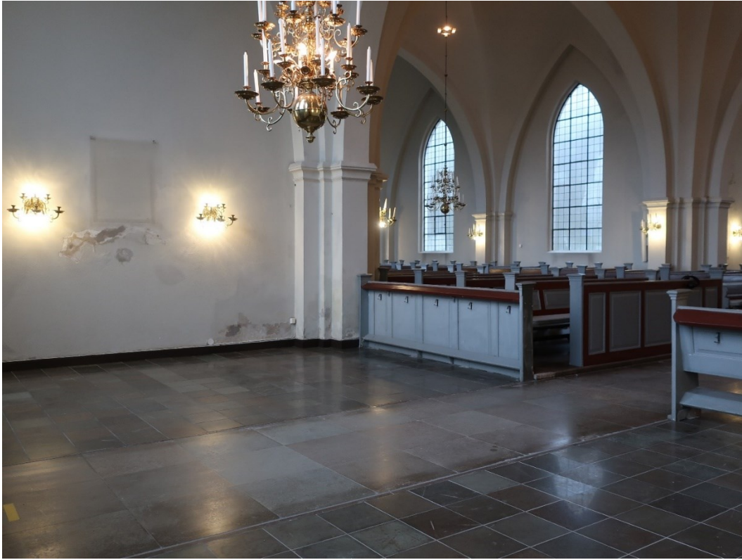
Efter åtgärder. Södra korsarmen.