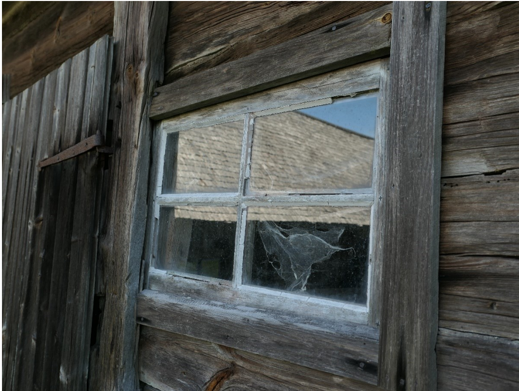
Före åtgärder. Exempel på fönster i behov av kittkomplettering och oljning.