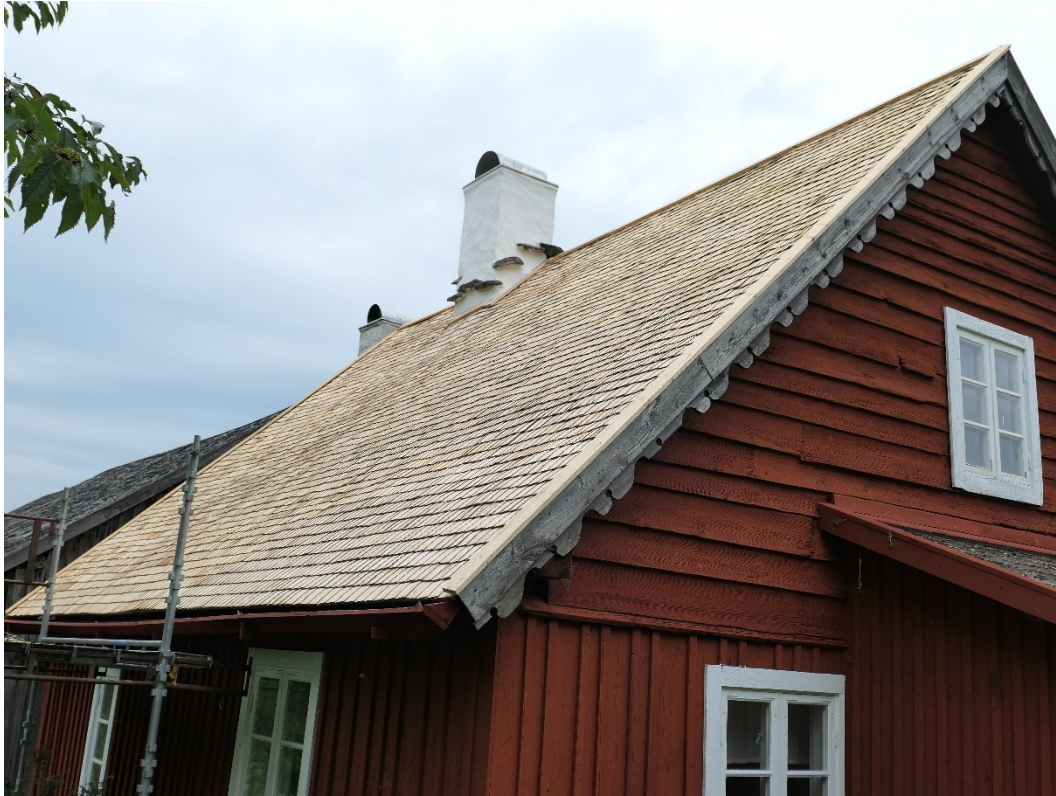
Efter åtgärder, Arrendatorsbostadens södra takfall, östra gaveln.