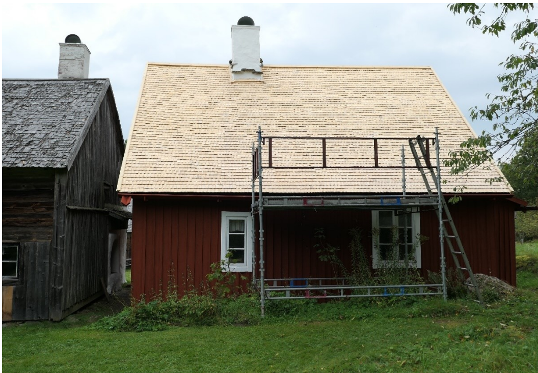
Efter åtgärder, Arrendatorsbostadens södra takfall.