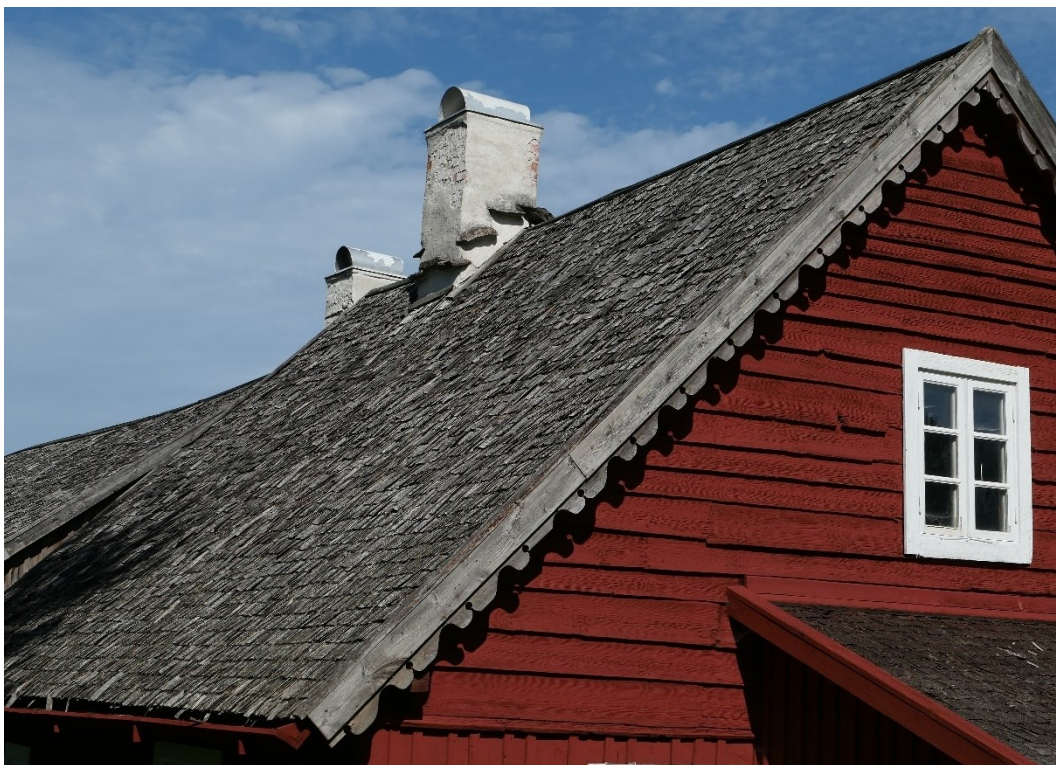
Före åtgärder. Arrendatorsbostaden, södra takfallet och östra gaveln.