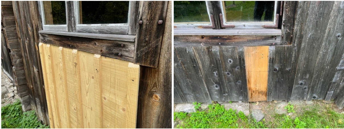
Efter åtgärder. Södra fasaden med ersatt locklistpanel och en vänd panelbräda.