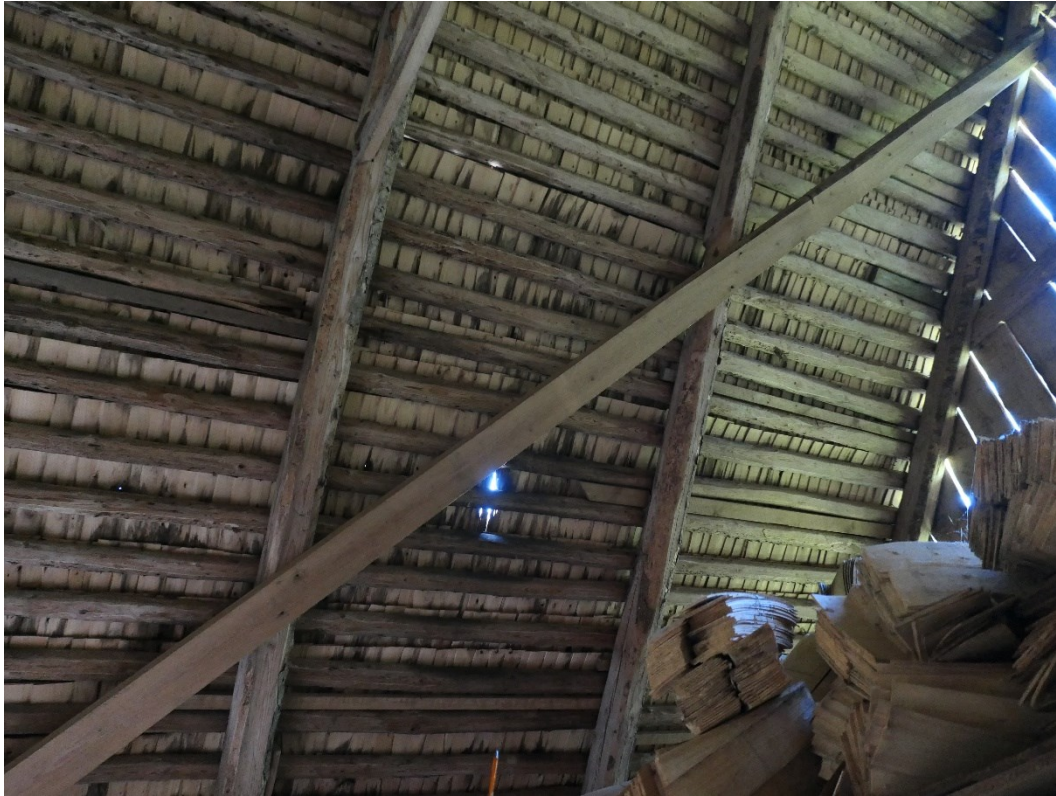
Före åtgärder. Exempel på skador. Östra ekonomibygnaden, västra takfallet mot innergården. Här kan man även se tak lagt utan förskalning och att takspånens övre kant vippar in mellan läkten.