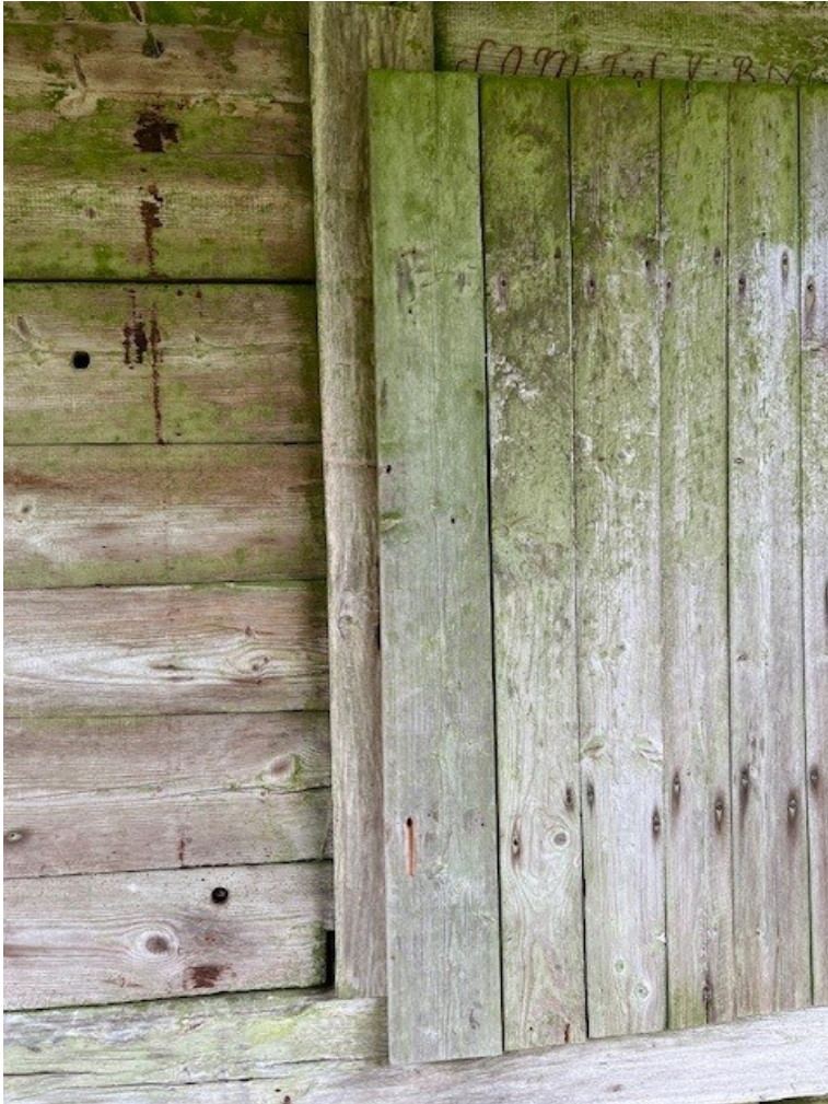
Dörr i västra fasaden, brädan längst till vänster har spikats fast.