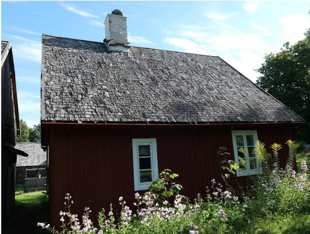
Före åtgärder. Arrendatorsbostaden, södra takfallet.