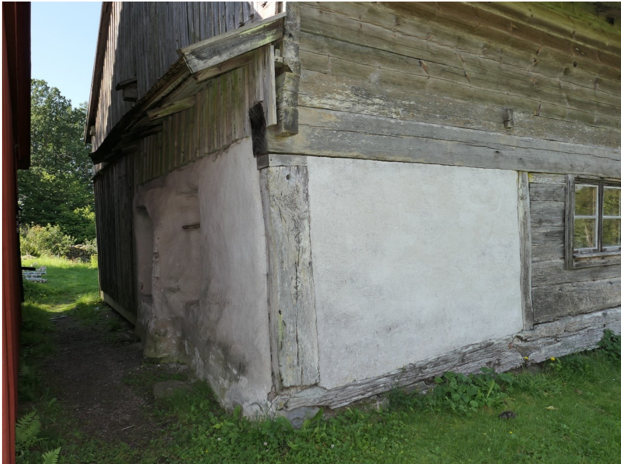
Före åtgärder. Putsade partier.