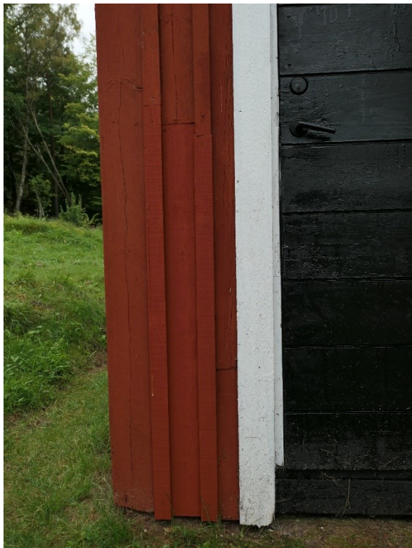
Vid farstudörren, locklister och panelbrädan i mitten är bytta.