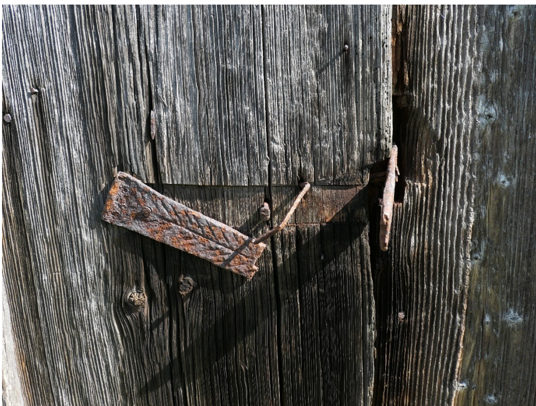
Före åtgärder. Södra gavelfasaden. Trappa och gångjärn.