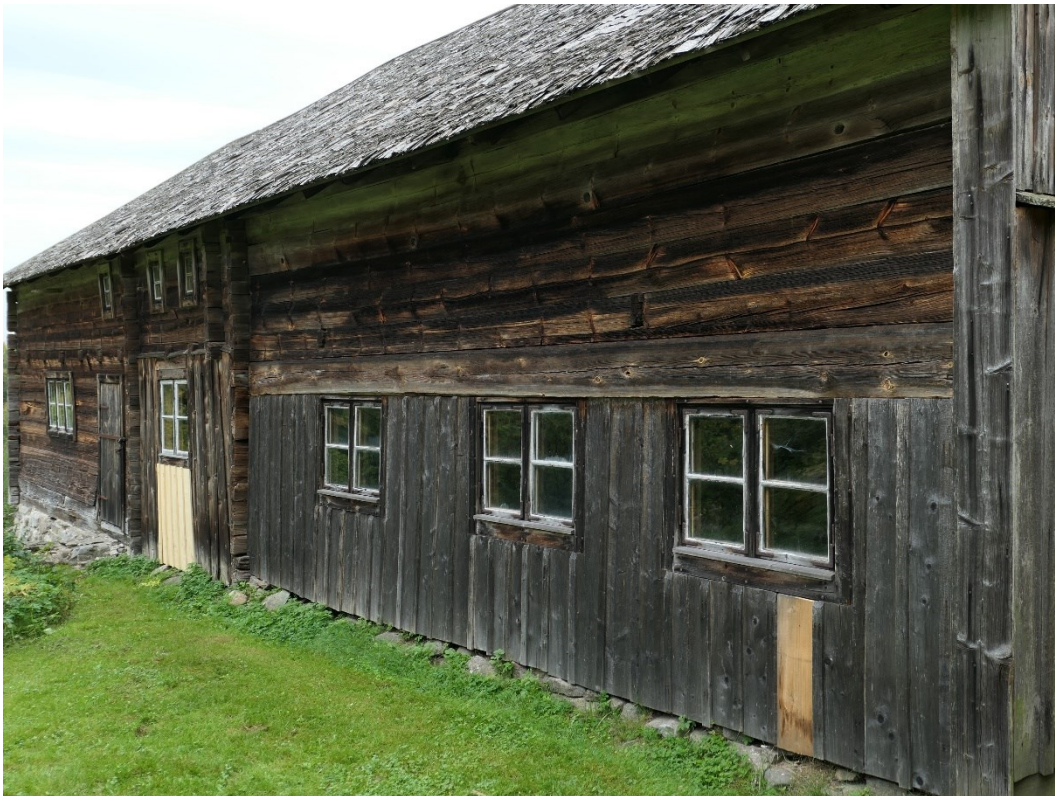
Efter åtgärder. Södra fasaden med ersatt locklistpanel och en vänd panelbräda.