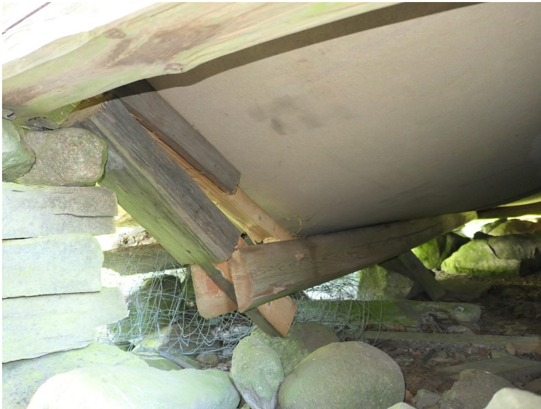
Före åtgärder. Golvbjälke som brutit i befintlig skarv.