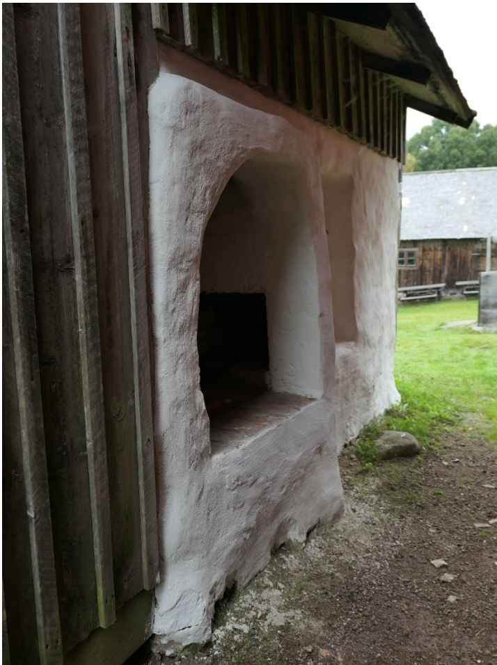
Efter åtgärder. Putsade och vittade partier.