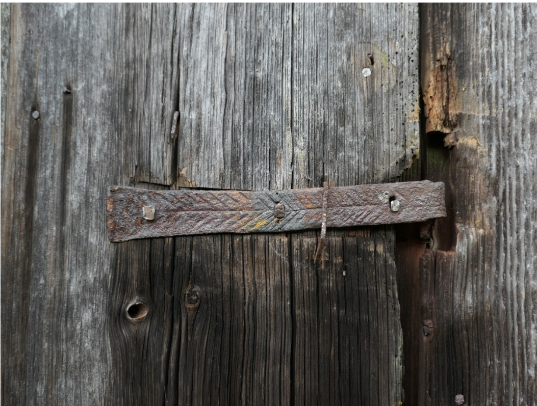
Efter åtgärder. Trappa och svetsat gångjärn, lägg märke till mönstret på gångjärnet.