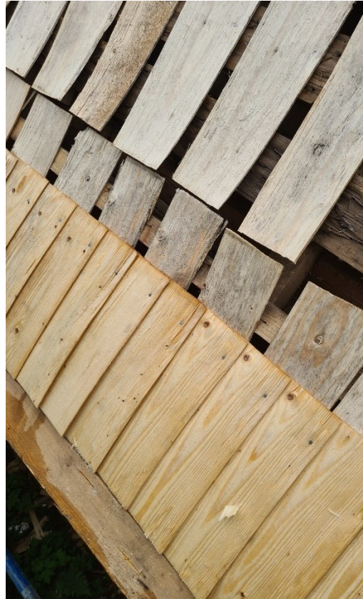
Under arbete. Spånen rivs och nya läggs med förskalning och nya täckande spån.