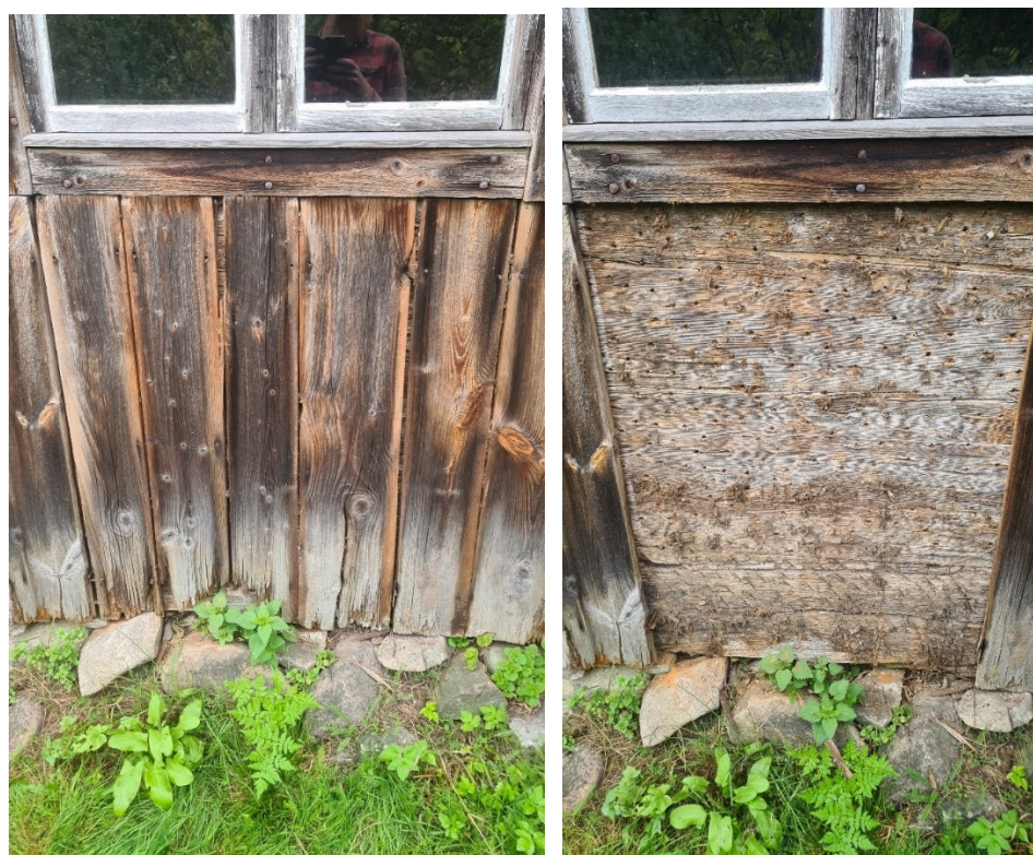
Under arbete. Skadad locklistpanel tas bort.