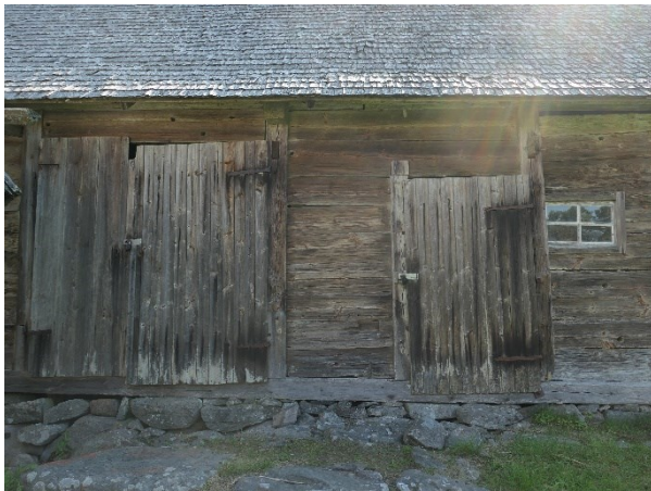
Före åtgärder. Dörr 1 och 2. Fönster 1.