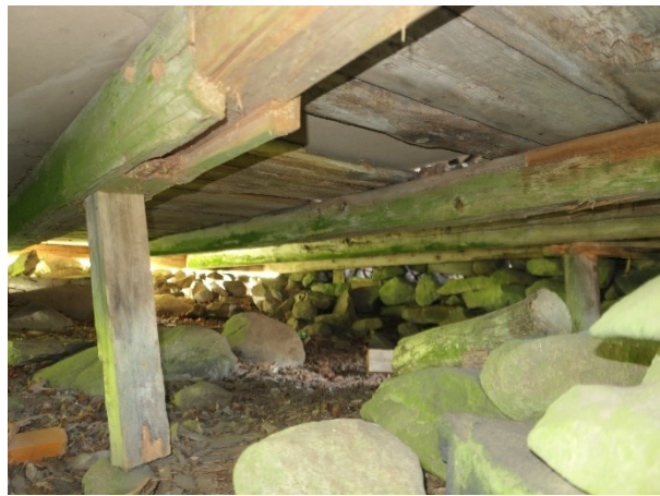
Före åtgärder. Den brutna golvbjälken sedd från norra gaveln. Stöttor finns sedan tidigare under flera av golvbjälkarna.