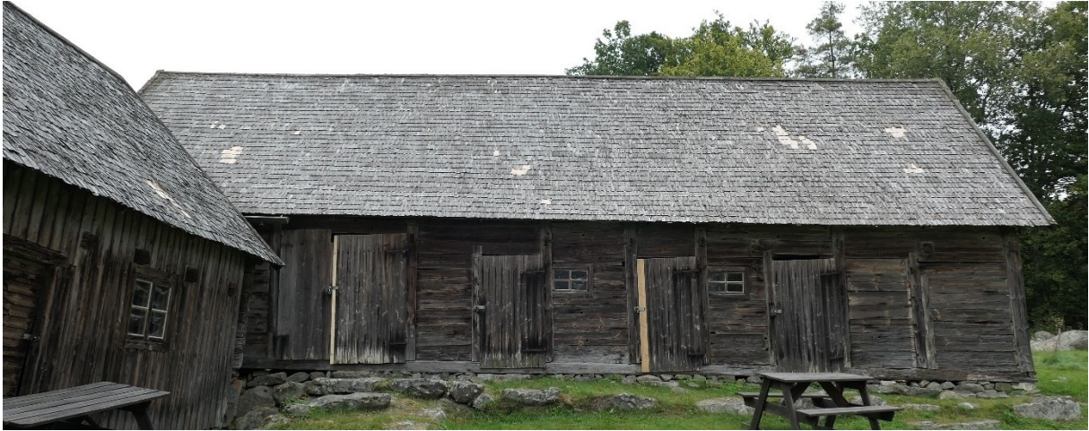
Efter åtgärder. Lagningar syns som ljusare partier. Till vänster norra ekonomibyggnaden, rakt fram östra ekonomibyggnaden.