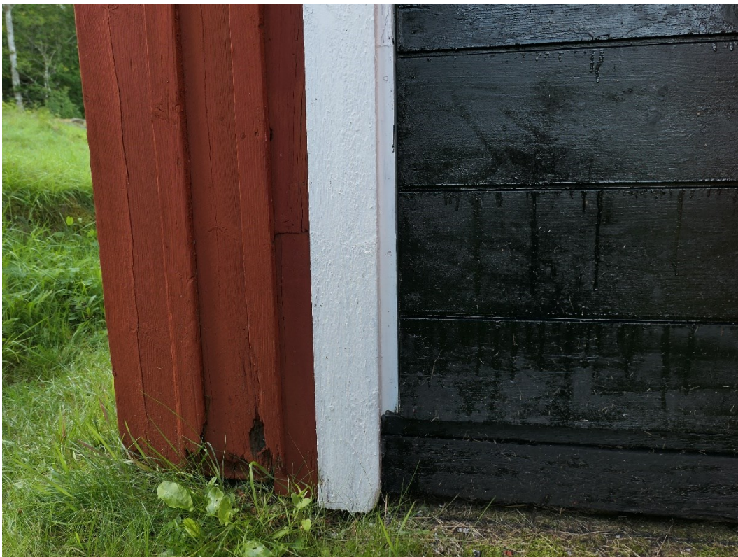
Före åtgärder. Arrendatorsbostaden, skadad locklistpanel invid farstudörren.