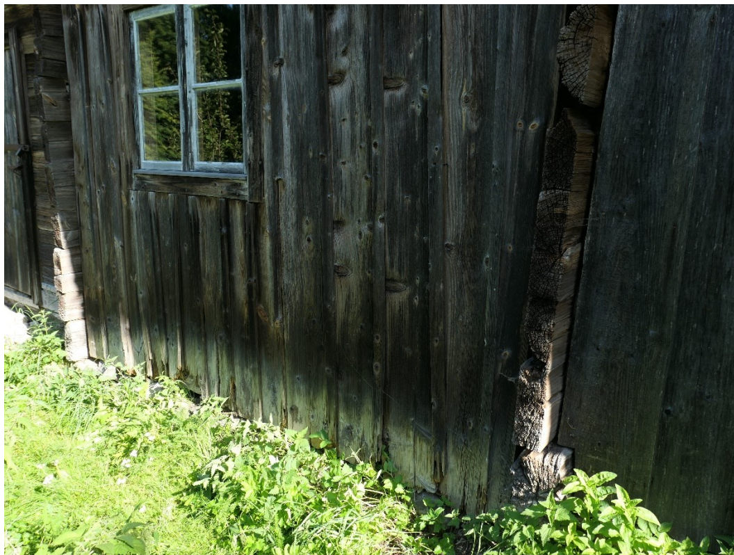
Före åtgärder. Södra fasaden med locklistpanel och knutrader.