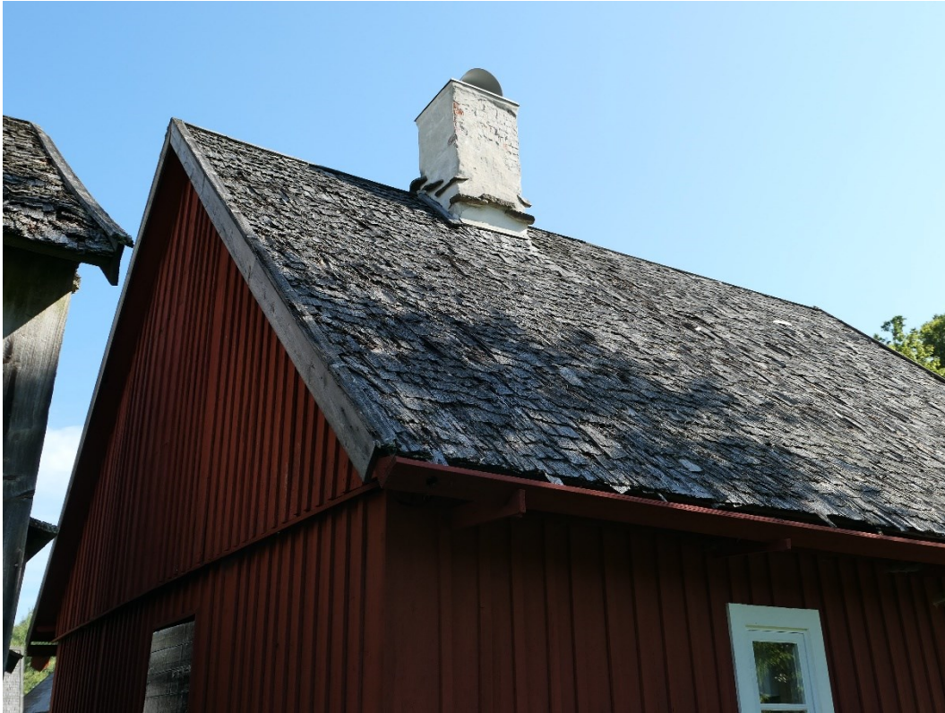
Före åtgärder. Arrendatorsbostaden, södra takfallet, västra gaveln och skorsten. Vattenutkastare saknades.