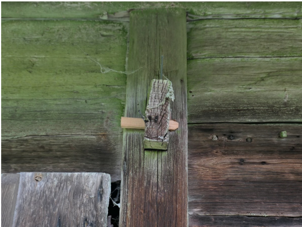
Före och efter åtgärder. Östra fasaden stickbjälke med skadad och ersatt kil (blåa).