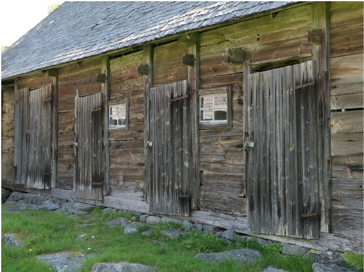
Före åtgärder. Västra gårdsfasaden med dörrar och fönster.