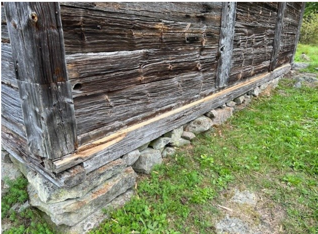
Efter åtgärder. Fotträ och marknivå vid södra gavelfasaden.