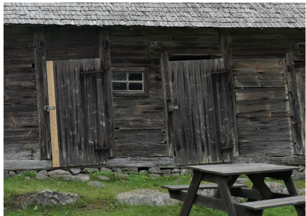
Efter åtgärder. Västra gårdsfasaden.