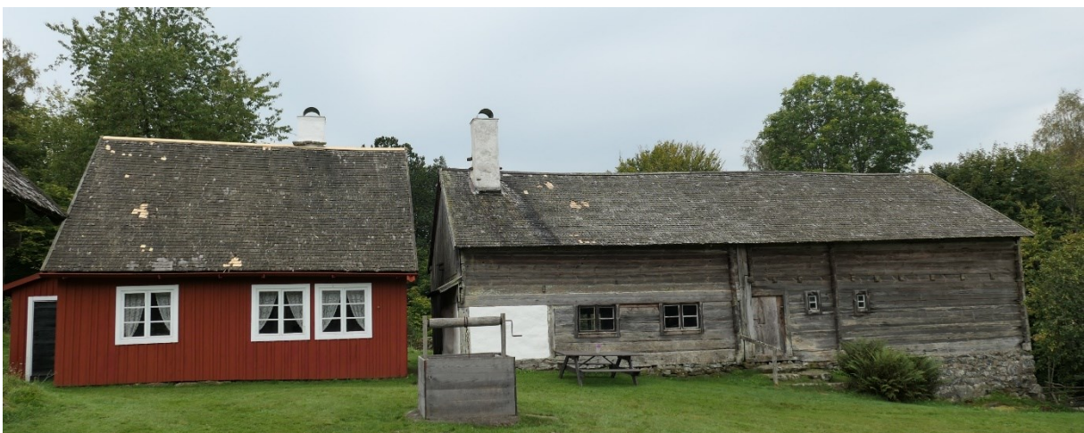
Efter åtgärder. Norra takfallen på Arrendatorsbostaden och Boningshuset.