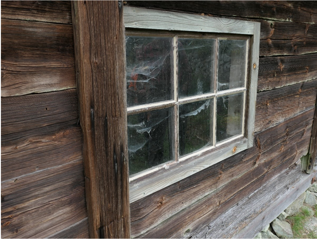
Efter åtgärder. Exempel på fönster som kittkompletterats och oljats på ekonomibyggnad.