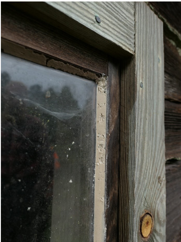
Exempel där man ser att fåglar ätit på nytt kitt med peppar.