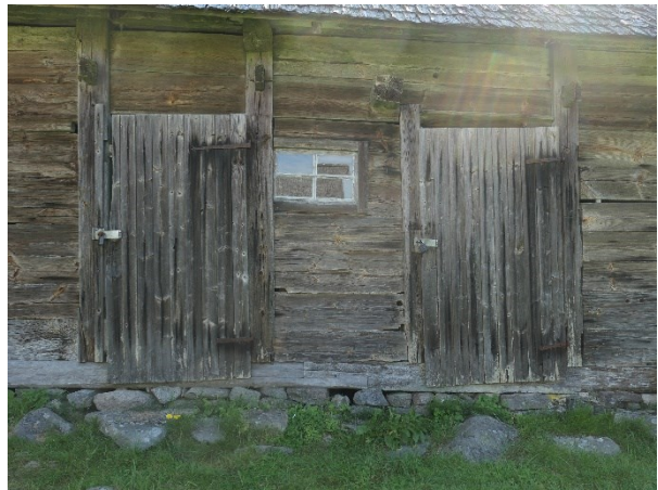
Före åtgärder. Dörr 3 och 4. Fönster 2.