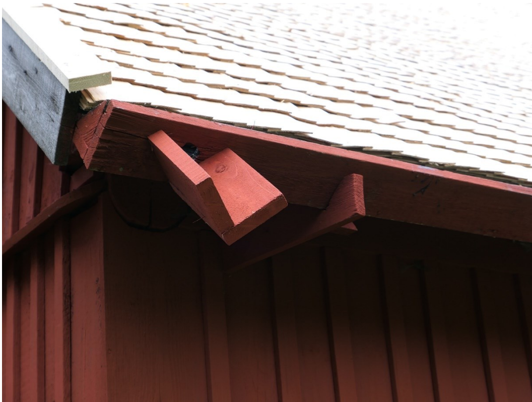
Efter åtgärder, takfall, solbräda, hängränna och vattenutkastare.