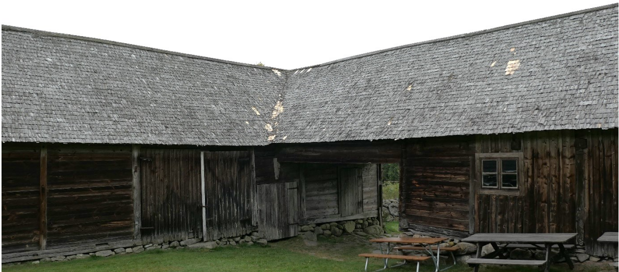
Efter åtgärder. Till vänster västra ekonomibyggnaden, till höger norra ekonomibyggnaden.