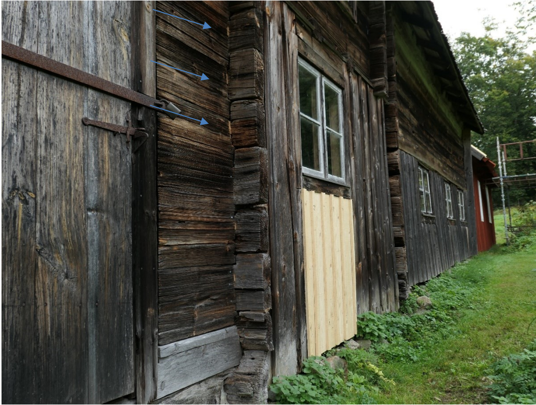
Efter åtgärder. Södra fasaden med ersatt locklistpanel. Knutarna är kilade (några markerat med pilar).