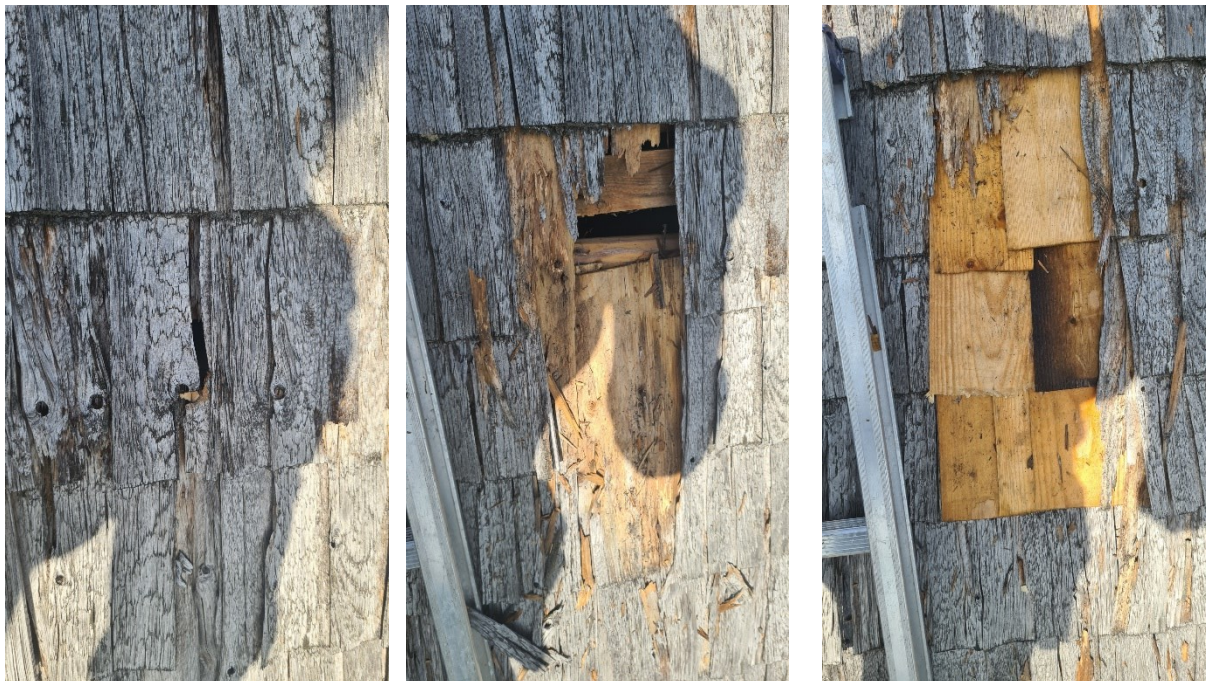
Under arbete. Exempel på lagning där skadade stickespån tas bort och ersätts.