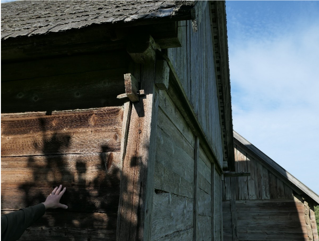
Nordöstra hörnet med skadad hörnstolpe med stickbjälke mot öster. Stopen ska förstärkas provisoriskt.