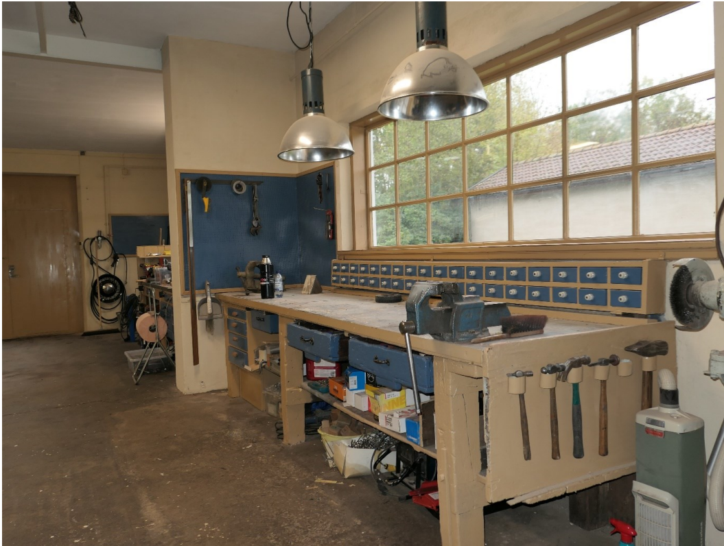
Foto i 1930-talsdelen mot tillbyggnaden i öster. Fönstret vetter mot söder.