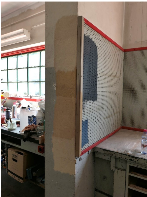
Fyra gula väggfärger provströks, den understa valdes som mest liknande underliggande befintlig gul färg.