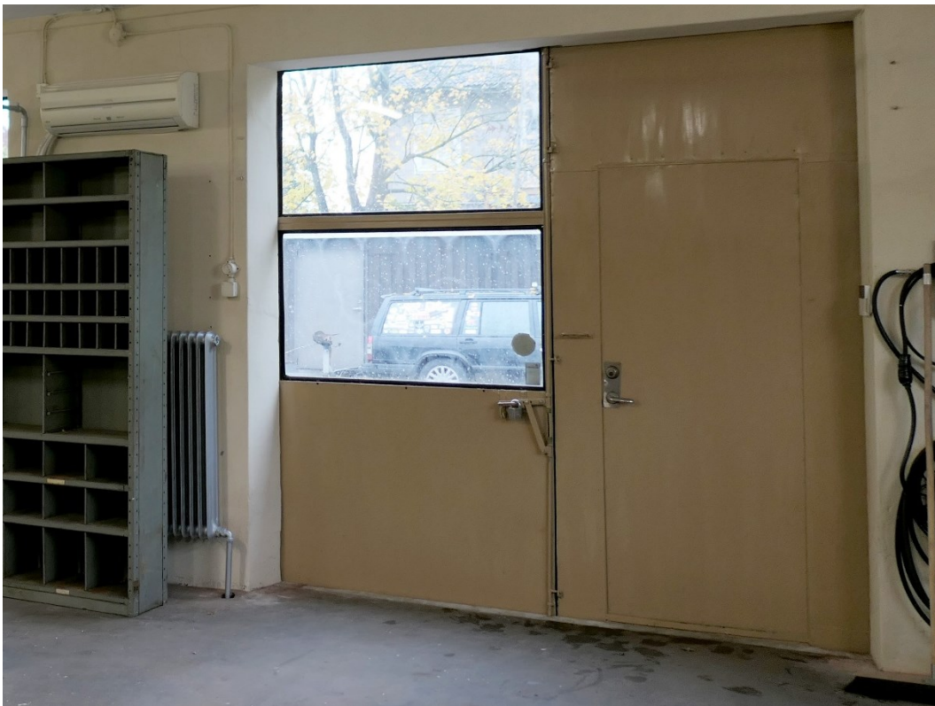
Portar och dörrsmyggar efter lagningar och målning.