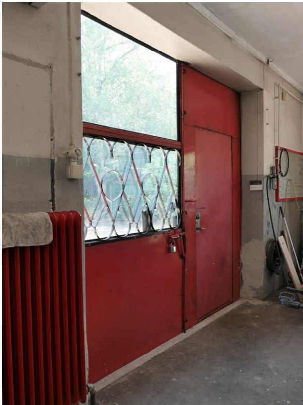
Portar mot öster.