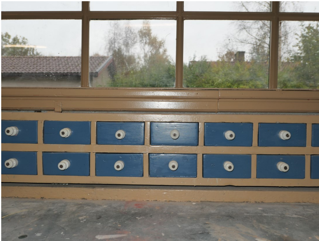
Detalj av handbyggda lådor i 1930-talsdelen.