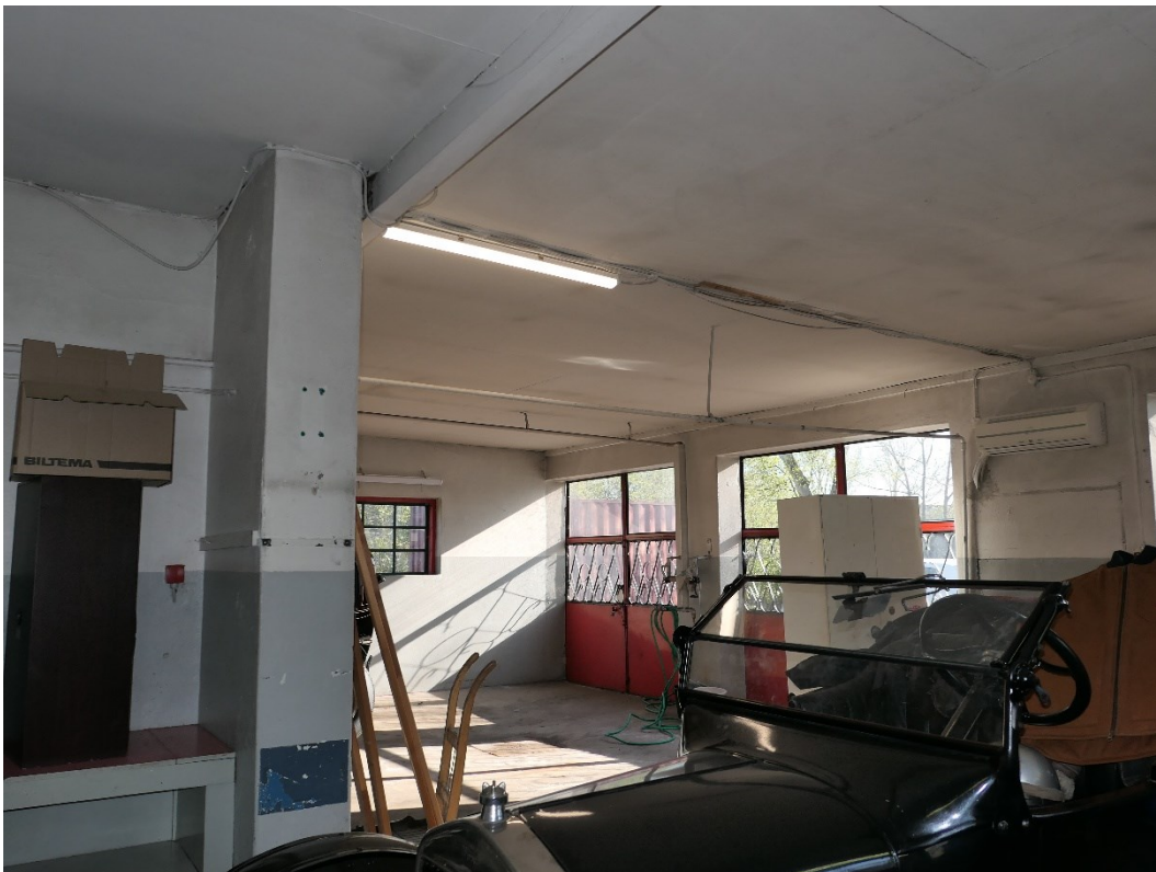
Före åtgärder. Verkstadens utbyggnad från 1940-talet till höger i bild.