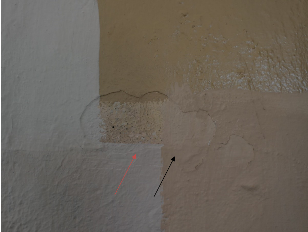
Provstrykning väggfärg mot den underliggande gula väggfärgen i 1930-talsdelen, röd pil befintlig färg och svart pil vald färg.