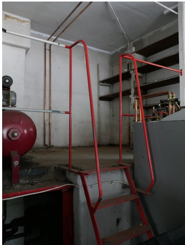
Före åtgärder. Vagg bakom lådor, gul väggfärg som troligen aldrig målats över. Trappa i 1930-talsdelen.