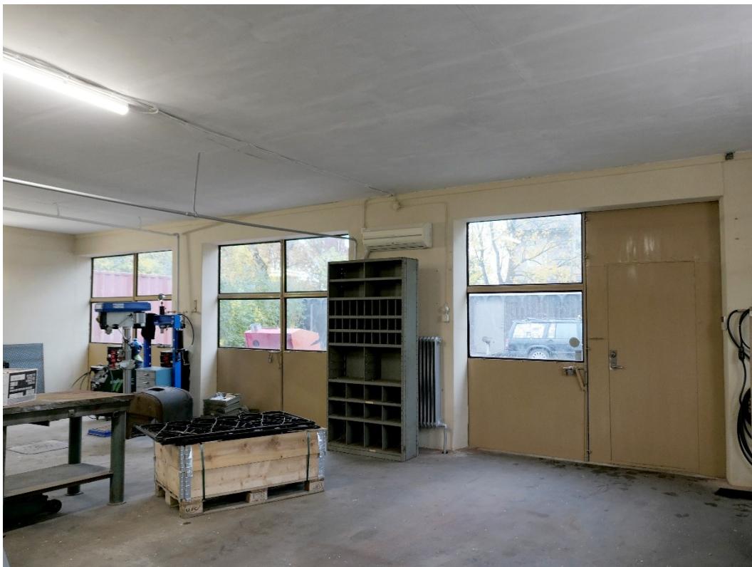
Vy mot väster och verkstadsportarna. Återstår att montera de invändiga gallren.