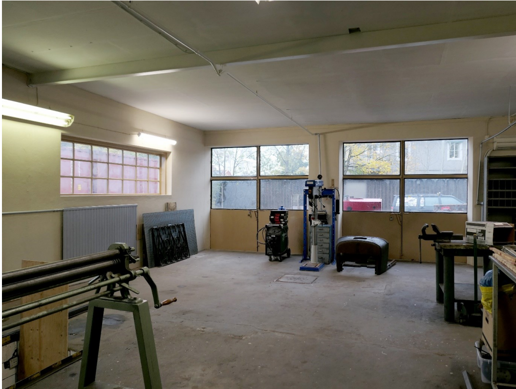
Vy mot väster och verkstadsportarna. Återstår att montera de invändiga gallren som på bilden står lutade mot väggen.