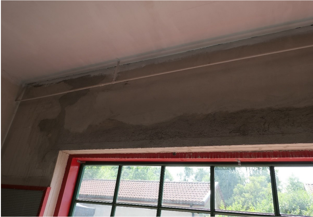
Under arbete. Putslagning ovan fönster mot söder.