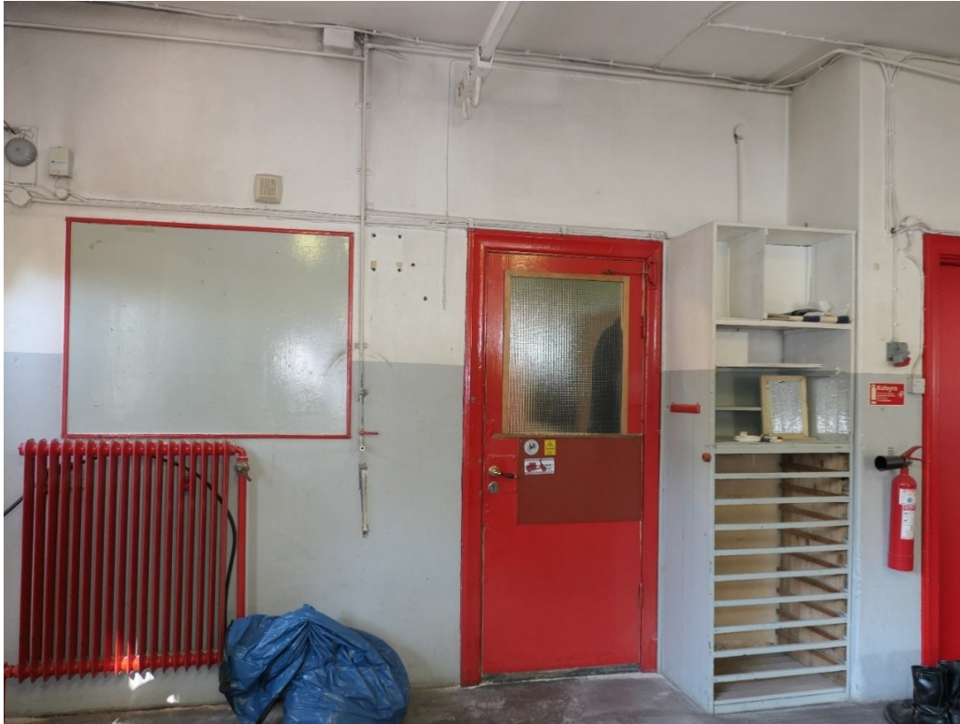
Före åtgärder. Verkstaden, dörr mot kontoret. Lådor är tillfälligt urplockade.