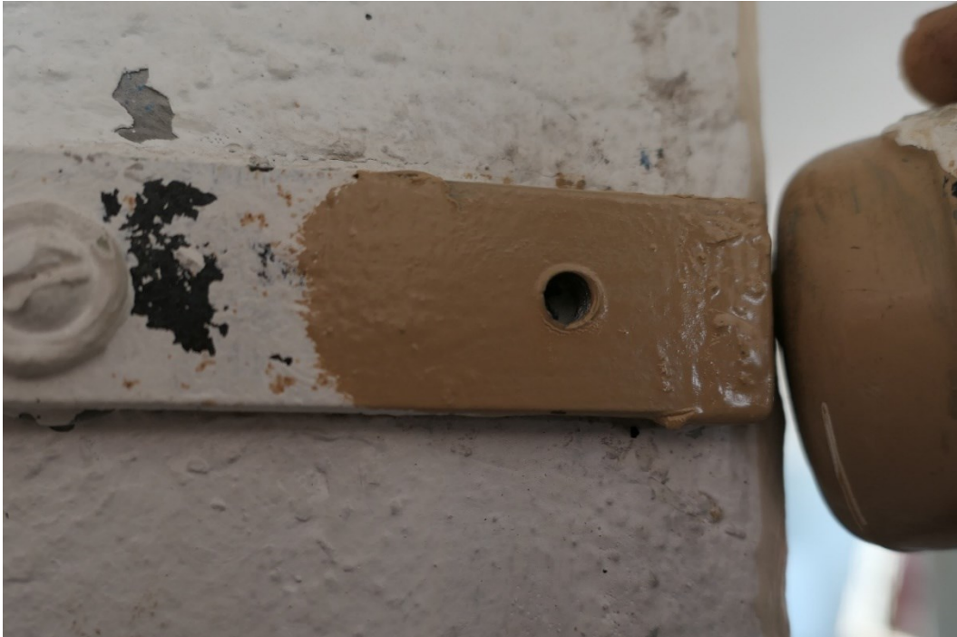
Provstrykning ljusbrun färg, i jämförelse med den samma strömbrytaren.