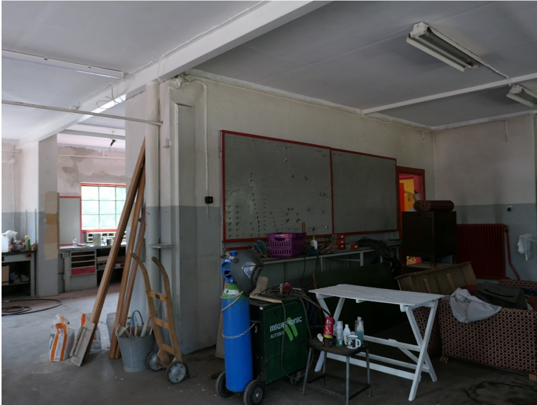
Fotograferat från tillbyggnaden in mot 1930-talsdelen. Vy mot sydväst.