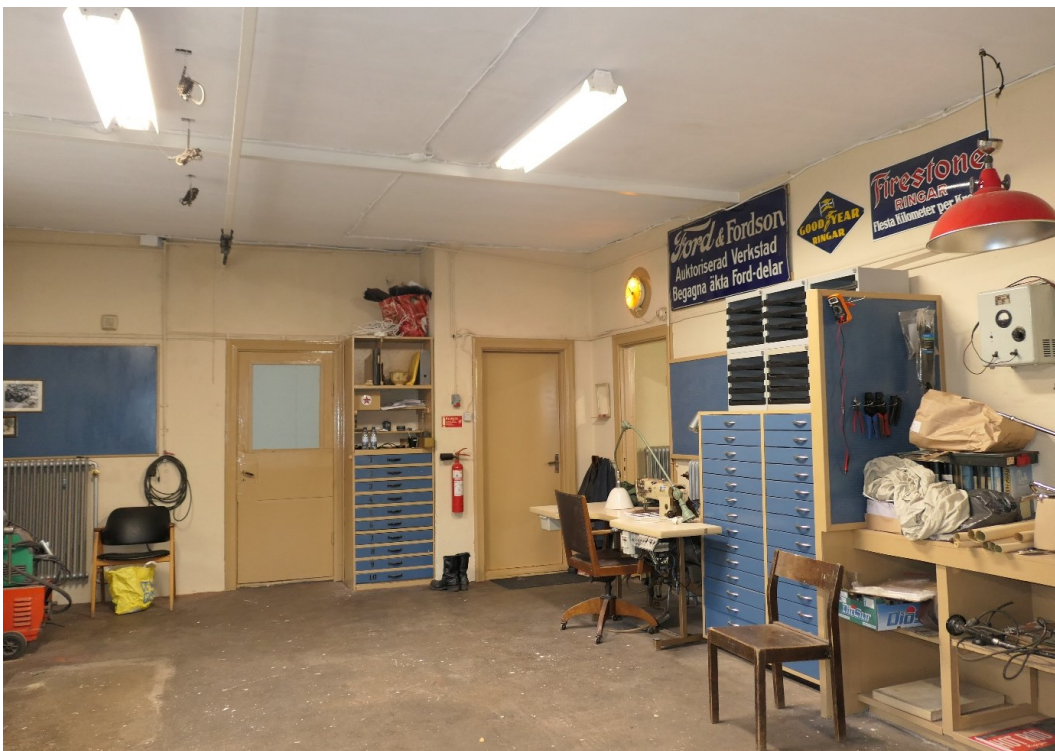
Foto i 1930-talsdelen, vy mot kontoret i väster.