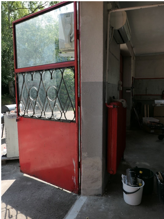
Putslagning vid port mot öster, vägg och tröskel.