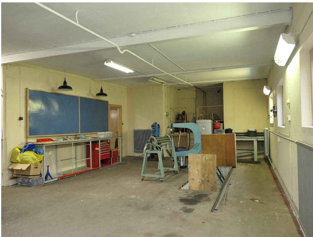
Norra delen av verkstaden, vy mot väster.