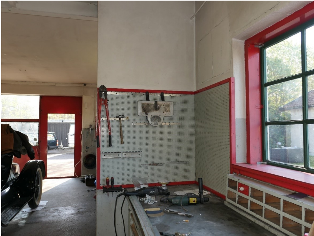
Före åtgärder. Verkstadens äldsta del med vy mot öster och tillbyggnaden från 1940-talet.