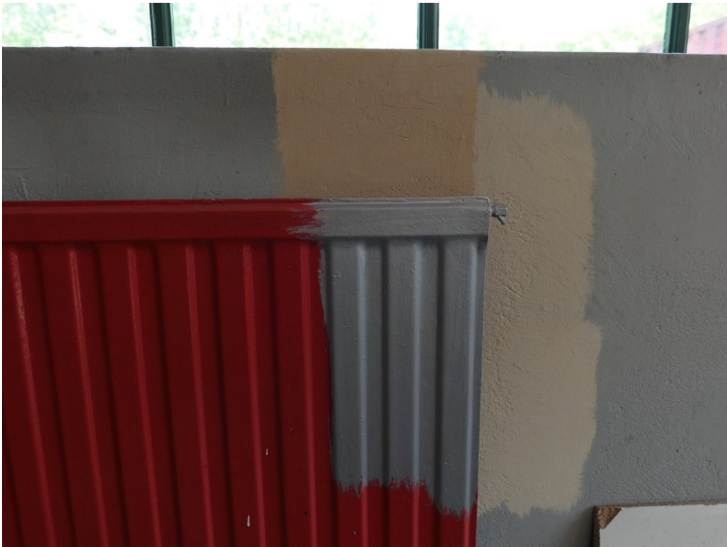
Provstrykning silverfärgad elementfärg och två gula nyanser på vägg. Den gula till höger i bild valdes som liknande den understa gula väggfärgen som hittats. Grå väggfärg och röd elementfärg var befintliga färger.