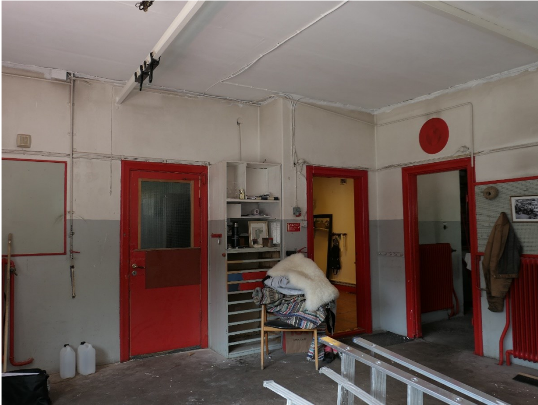
Västra väggen i verkstadens 1930-talsedel, dörrar mot butik och mot norra delen av verkstaden.