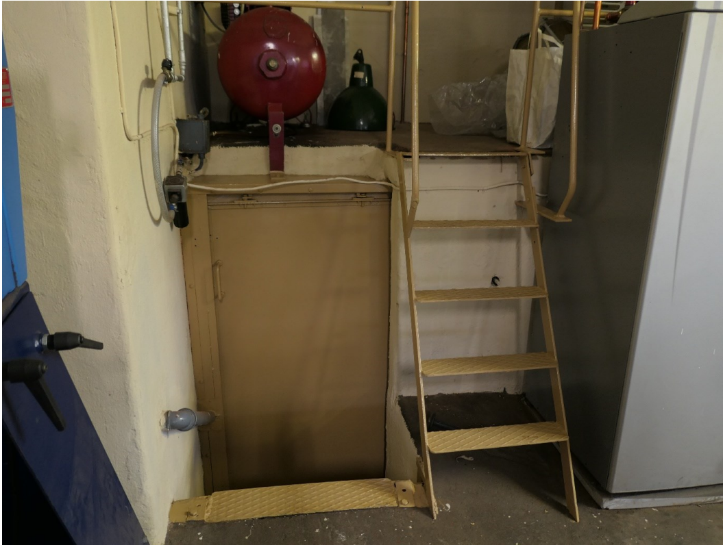
Trappa i 1930-talsdelen.