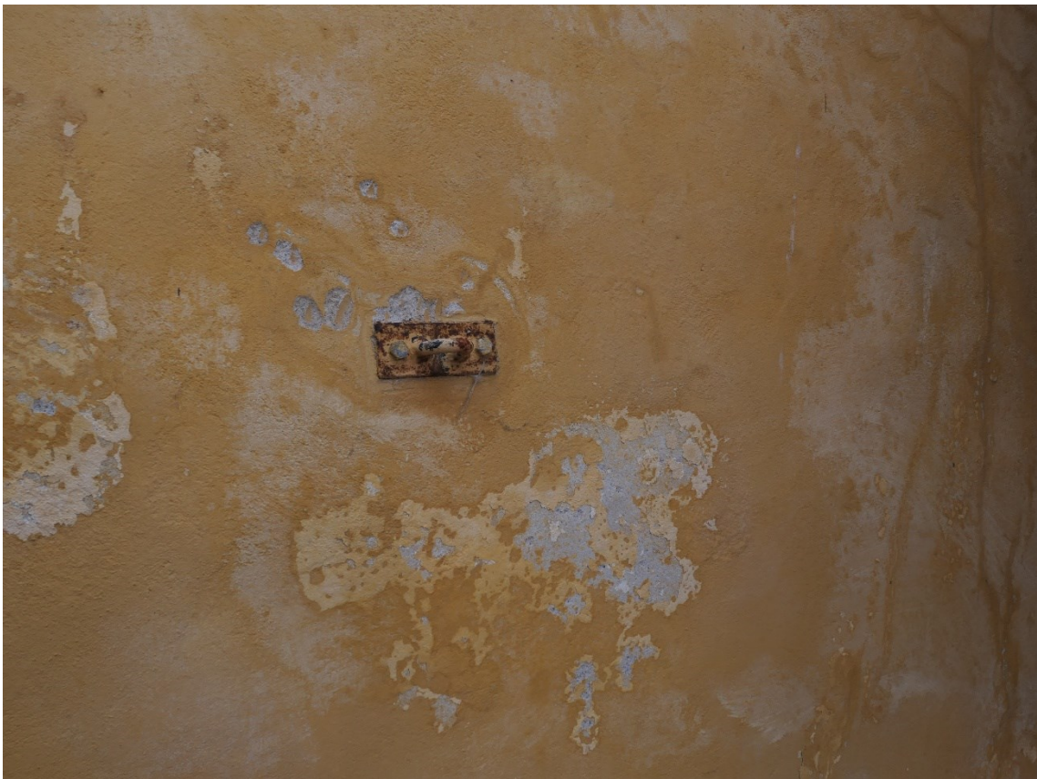
Stora hingststallets östra gavel.