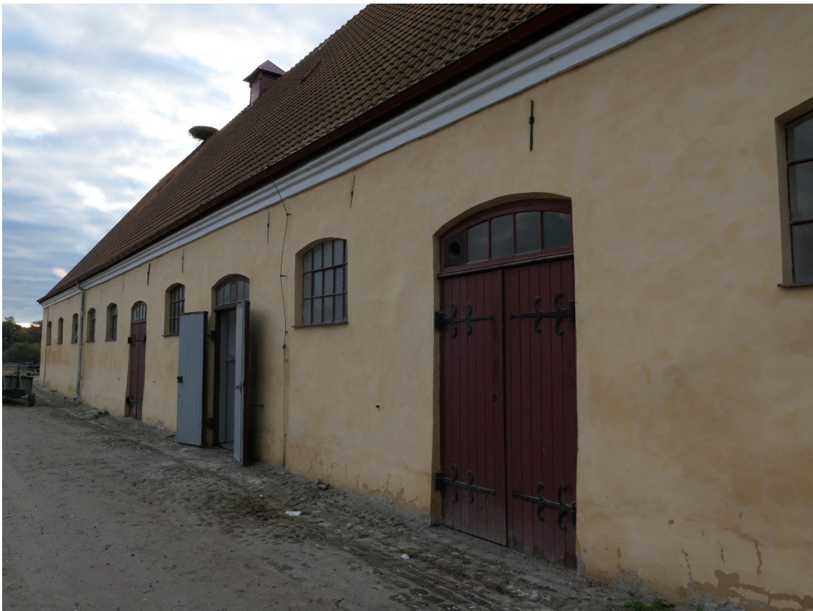
Norra unghäststallets norra fasad.