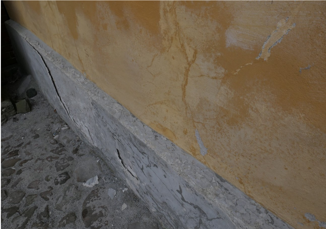
Stora hingststallets östra gavel.