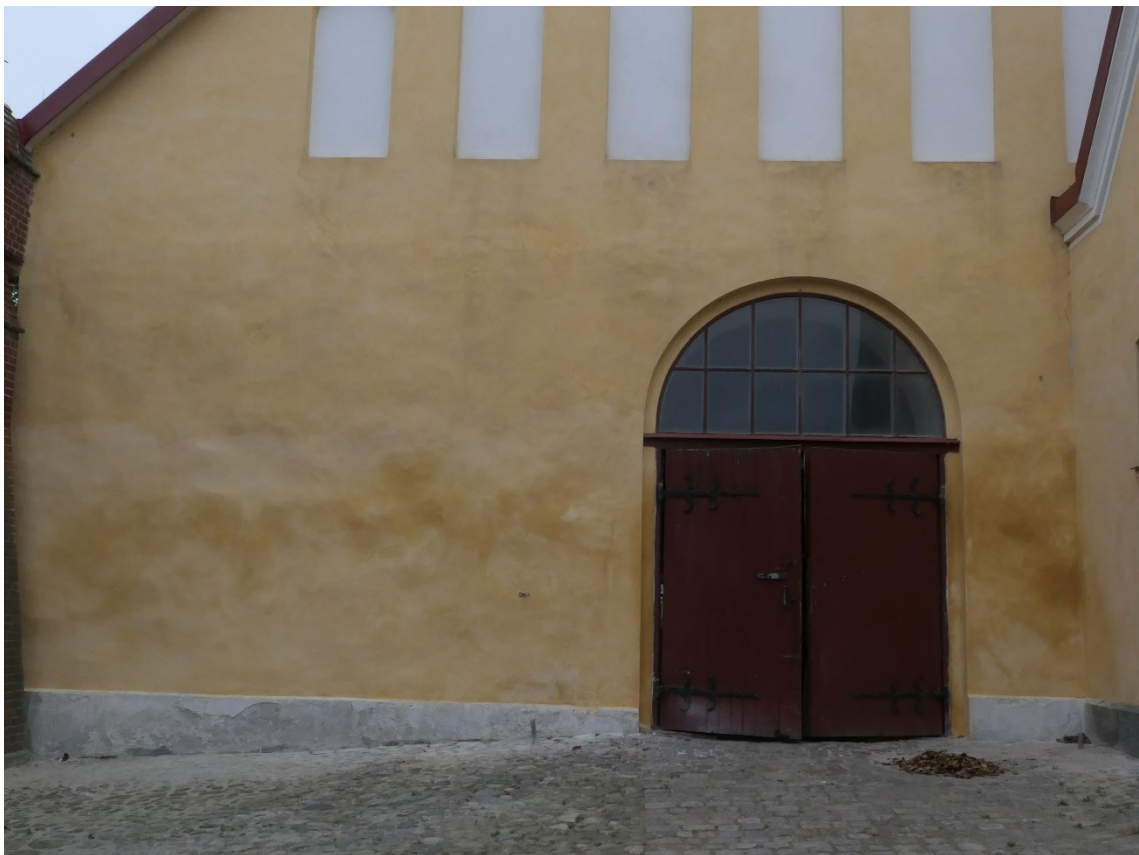
Stora hingststallets östra gavelfasad. Lagningarna 2024 är utförda i nivå under överljuset.