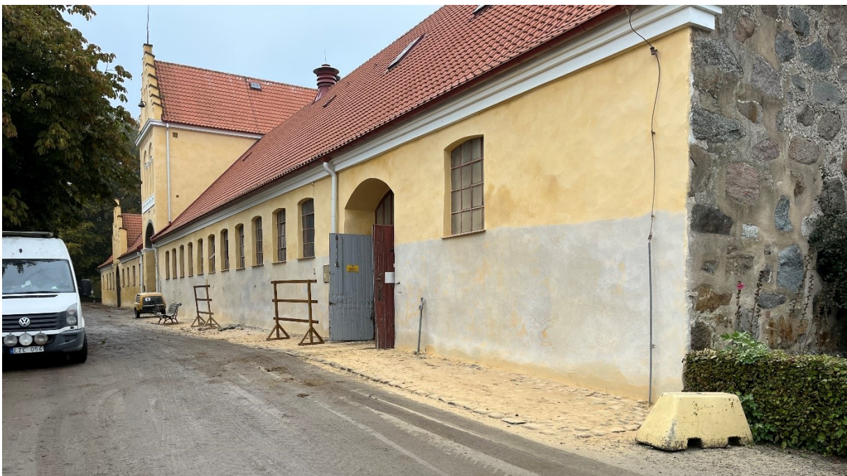
Elevstallet, fasaden under blästring. Blästring utfördes till den nivå som syns på bilderna.