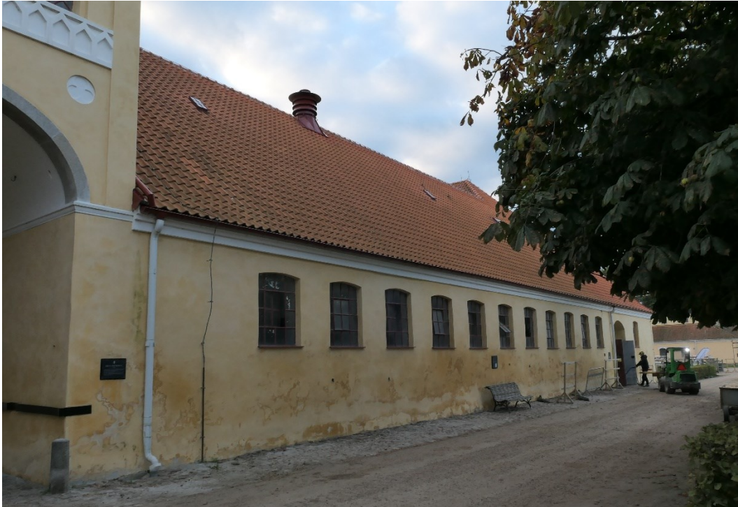
Elevstallets västra fasad.