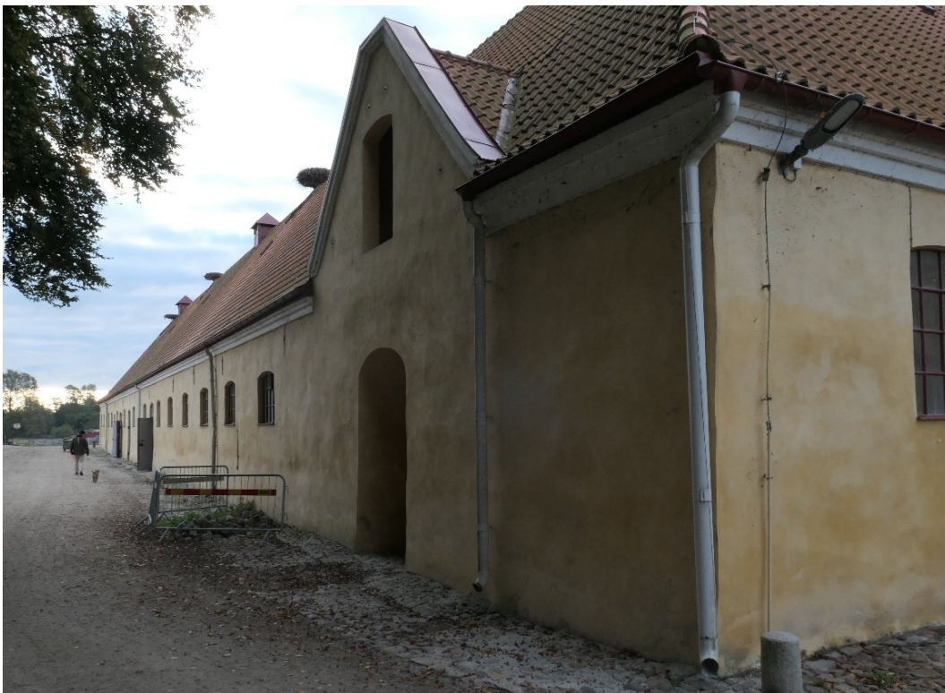
Norra unghäststallets norra fasad.