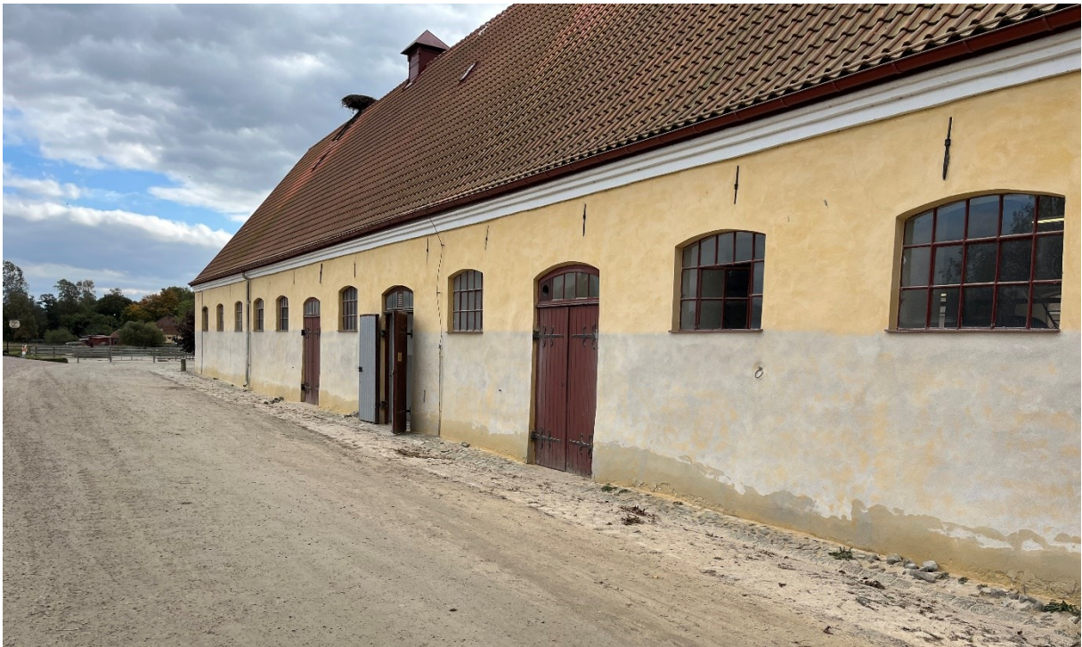
Norra unghäststallet. Fasaden har blåstrats.